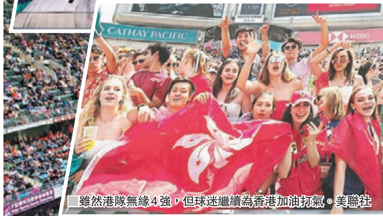
雖然港隊無緣4強，但球迷繼續為香港加油打氣。