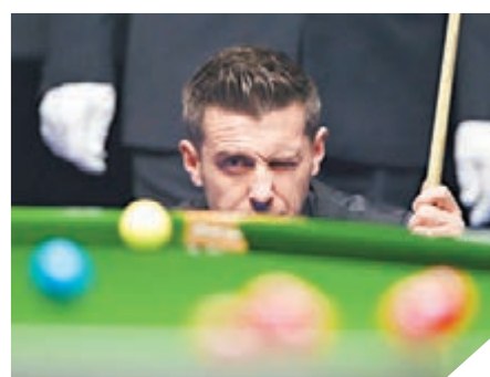
香港文匯報記者 陳曉莉

中國桌球公開賽，昨日在北京國家奧林匹克體育中心展開21局11勝的冠軍爭霸戰，衛冕冠軍沙比(左圖)與鶴健士前晚分別戰勝凱倫威爾遜與羅拔臣，躋身決賽。昨日的冠軍爭霸戰，沙比以11：3大勝，4年內3度登頂，成為17年來首位衛冕成功的選手。本項賽事總獎金達100萬英鎊(約1,103萬港元)，是繼世錦賽後第二個獎金達百萬英鎊的比賽，冠軍獎金22.5萬英鎊(約248.9萬港元)。香港文匯報記者 陳曉莉