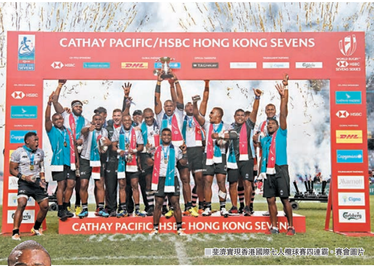
斐濟實現香港國際七人欖球賽四連霸。