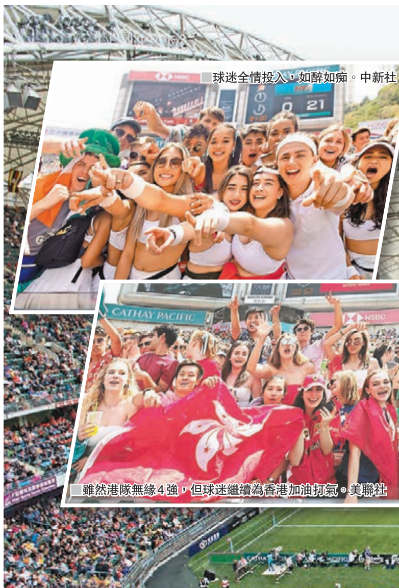
球迷全情投入，如醉如痴。