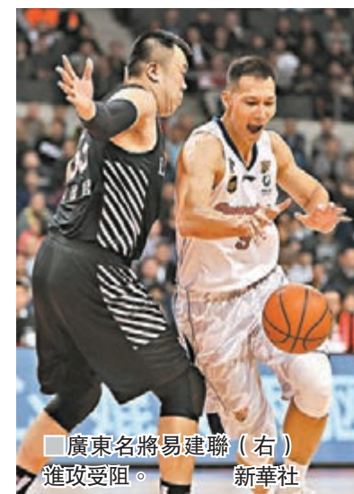
廣東名將易建聯(右)進攻受阻。

中國男籃職業聯賽(CBA)準決賽第五場較量，前晚繼續在東莞上演。儘管易建聯發揮出色，拿下全場最高的39分，但廣東宏遠沒能複製上一場的勝利，最終以97：111不敵對手。遼寧本鋼以總成績4：1率先晉級總決賽。這是遼寧隊在近四個賽季第三次打進總決賽，其對手將是浙江廣廈與山東高速之間的勝者。浙江對山東的準決賽系列賽，日前山東憑外援勞森得到全場最高的31分，幫助球隊113：103戰勝浙江廣廈，系列賽總比分3：2拿到賽點。兩隊今晚將在廣廈主場進行第6戰(有線62、202及262台今晚7時15分起直播)。香港文匯報記者 陳曉莉