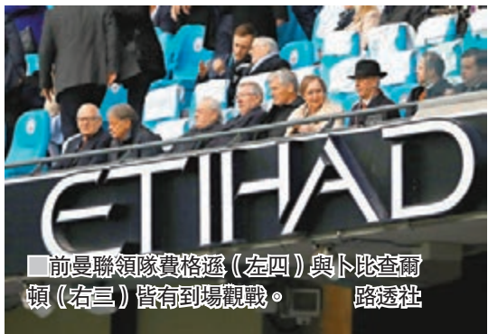
前曼聯領隊費格遜(左四)與卜比查爾頓(右三)皆有到場觀戰。