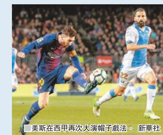
美斯在西甲再次大演帽子戲法。