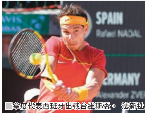
拿度代表西班牙出戰台維斯盃。

在首日比賽，拿度已經為西班牙先追平過一次，他同以3：0的盤數擊敗另一位德國球手的高舒列巴。然而在第二日的雙打，西班牙又輸一場，令德國再度領先。不過在昨日舉行的第四場，拿度首盤先以6：1的大比數取勝，之後施維列夫在餘下兩盤再以4：6僅取，最終令西班牙將場數追平至2：2。