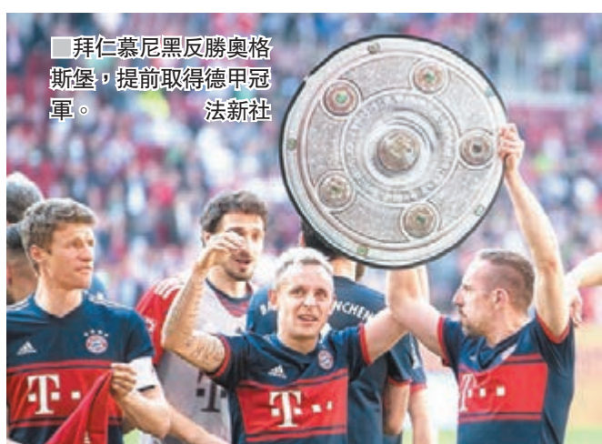
拜仁慕尼黑反勝奧格斯堡，提前取得德甲冠軍。