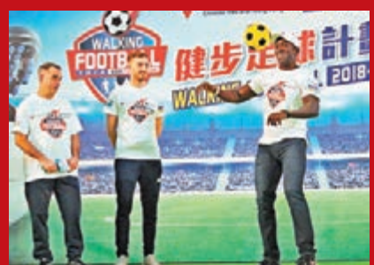
前曼聯球星約基昨日出席活動，並讚曼聯門將迪基亞今季表現最佳。