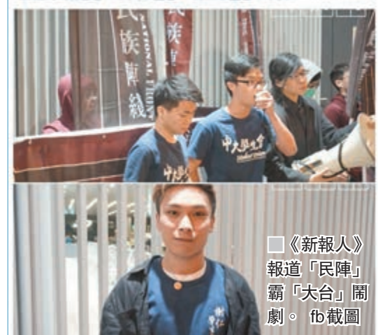
《新報人》報道「民陣」霸「大台」鬧劇。