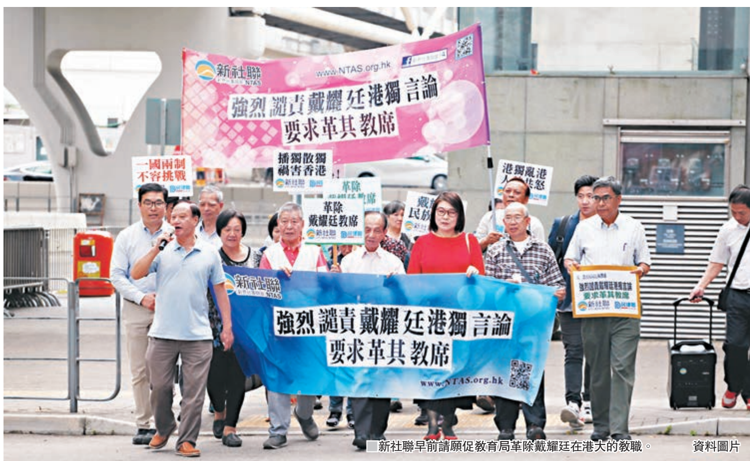
新社聯早前請願促教育局革除戴耀廷在港大的教職。

青年民建聯主席顏汶羽批評,戴耀廷多次在不同地方、不同場合提出「港獨」是選項,這是無稽說法。他指,香港市民均十分清楚香港是中國的一部分,雖然戴耀廷聲稱不支持「港獨」,但市民很清楚看到這只是「口講一套」,而集會上「獨派」中人聚集,也反映戴耀廷一直受到「港獨」分子的支持,與「港獨」分子時有互動,「若他真是中支持『港獨』,應向『港獨』分子說不!也應停止做出各種無聊的行為及論調。」