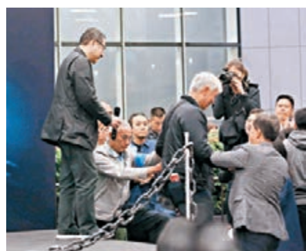
戴耀廷前晚在支持他的集會上堅持不會改變觀點。

該會已去信港大要求校方撤銷戴耀廷的教席，促請校方盡快回應，若未獲回覆，不排除進一步到港大組織集會。