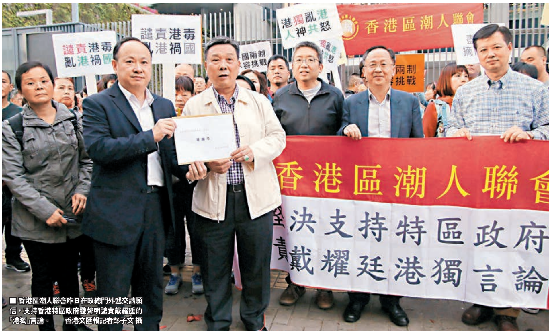
香港區潮人聯會昨日在政總門外遞交請願信，支持香港特區政府發聲明譴責戴耀廷的「港獨」言論。

香港文匯報訊（記者 文森）違法「佔中」發起人、香港大學法律系副教授戴耀廷所謂「香港建國」的「港獨」言論，引起社會各界憤慨。逾百名香港區潮人聯會成員昨日發起集會，強烈譴責戴耀廷「港獨」言論，指對方嚴重違反國家憲法及香港基本法，破壞香港社會的繁榮穩定，以及傷害香港市民在內的全體中國人民感情。他們要求港大校方撤銷戴耀廷教席，要求政府依法處理「港獨」分子，並盡快履行基本法二十三條立法的憲制責任。