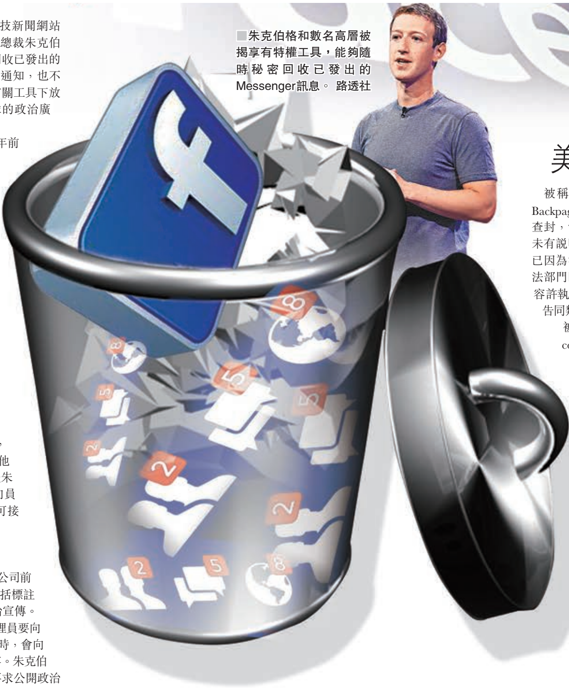
朱克伯格和數名高層被揭享有特權工具，能夠隨時秘密回收已發出的Messenger訊息。