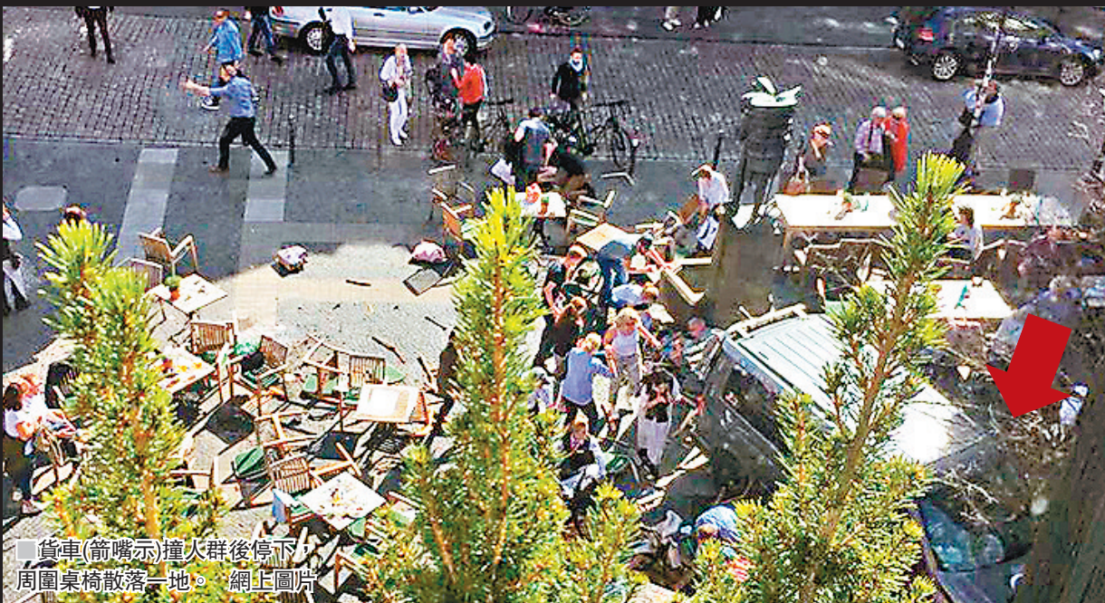
貨車(箭頭示)撞入群眾後停下，周圍桌椅散落一地。

事發地點是當地一家著名餐廳的露天茶座，現場照片顯示事發後桌椅散落一地，貨車則衝到餐廳門外。大批全副武裝警方事後封鎖現場，消防及救護人員到場展開救援，當局並呼籲其他人不要接近附近一帶。