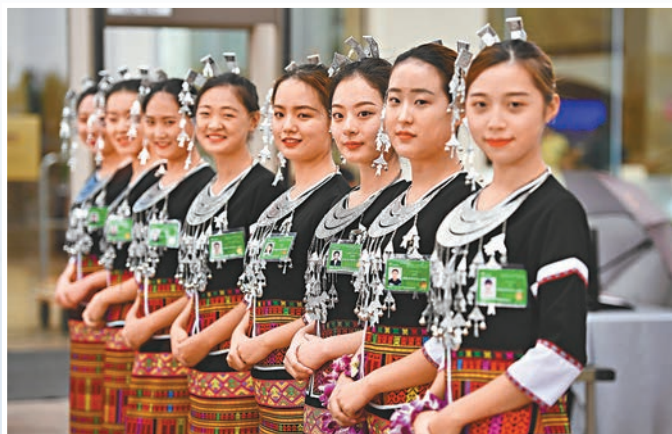
身穿黎族服飾義工準備迎接嘉賓。