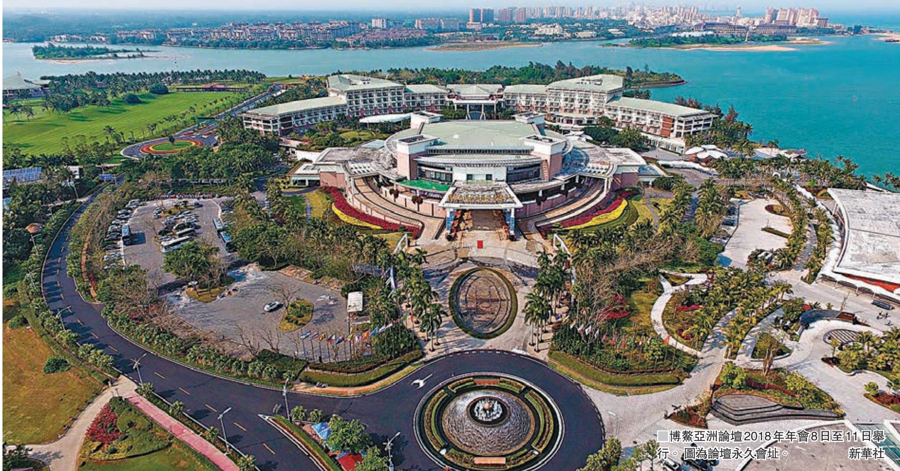
博鰲亞洲論壇2018年年會8日至11日舉行。圖為論壇永久會址。