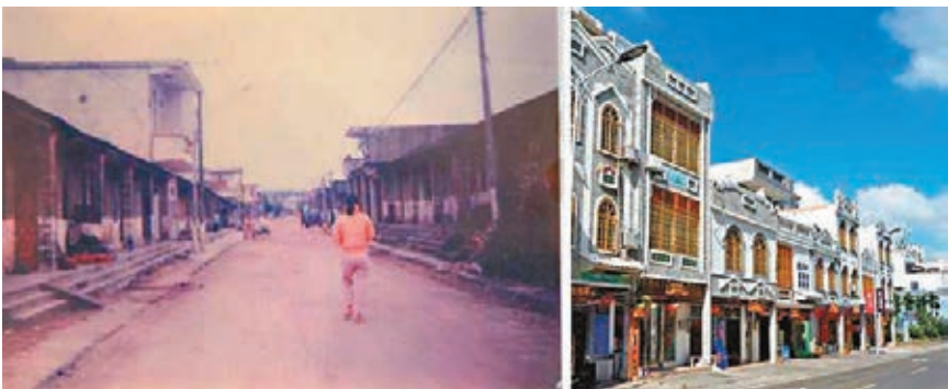
博鰲街道今昔。