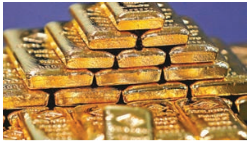
中美貿易摩擦持續升溫,加上美伊、美朝、英俄關係料持續影響市場,預期金價年內有望上探1,400美元。