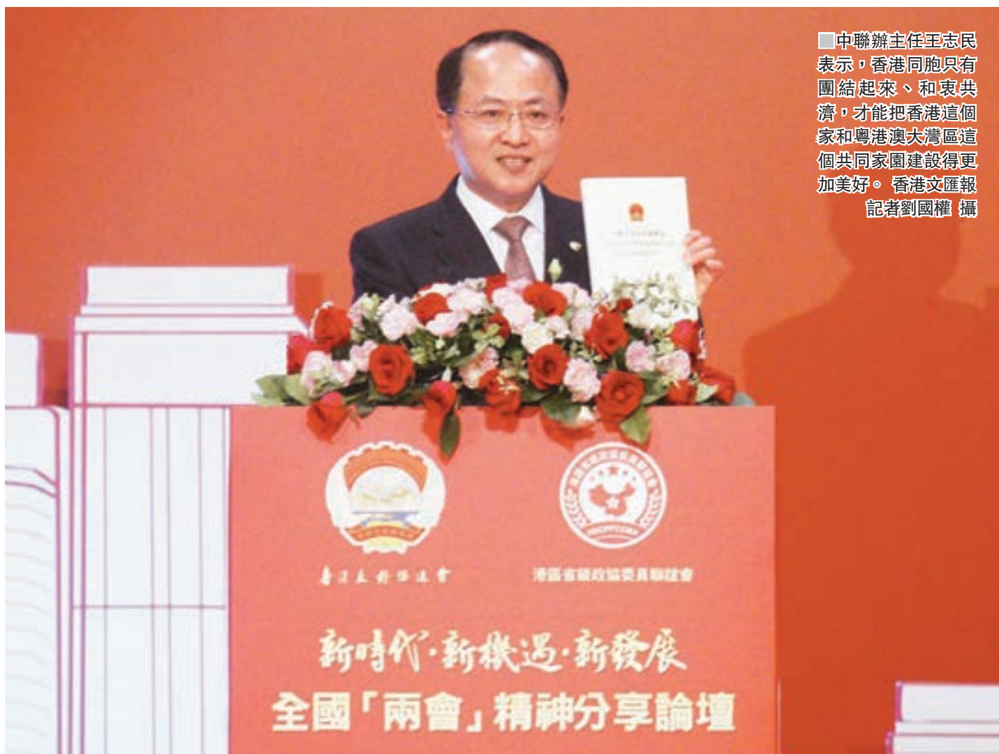
■中聯辦主任王志民表示，香港同胞只有團結起來、和衷共濟，才能把香港這個家和粵港澳大灣區這個共同家園建設得更加美好。

王志民指出，憲法修正案以創歷史紀錄的超高票通過，習近平總書記以全票再次當選國家主席和中央軍委主席並在全國人大會議閉幕會上發表重要講話，是這次全國兩會最重要的政治成果。他在演講中透過穿插鮮活生動的視頻，與在場嘉賓分享了此次兩會上最激動人心的五個經典時刻，包括憲法修正案通過、習總書記全票當選國家主席並進行憲法宣誓、習總書記在人大閉幕會上發表重要講話等。他指出，人民大會堂一次又一次響起經久不息的熱烈掌聲，體現了習總書記是全黨擁護、人民愛戴、當之無愧的黨的核心、軍隊統帥、人民領袖，是新時代中國特色社會主義國家的掌舵者、人民的領路人，反映了全體代表對這次修憲最重要政治成果的高度認同和對習總書記作為全黨全軍全國各族人民主心骨的由衷擁戴，展現了13億多人民對在習總書記堅強領導下，風雨無阻、高歌行進，實現中