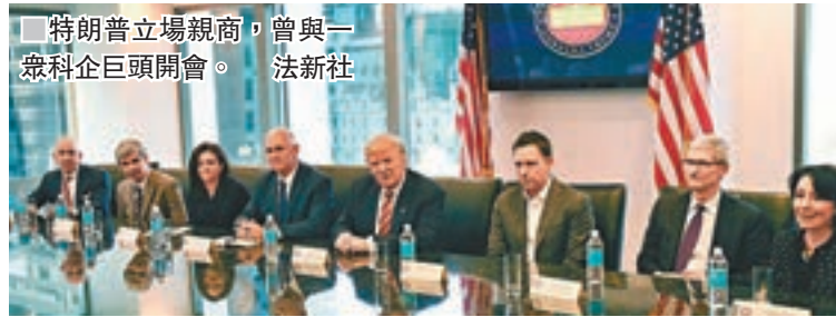
特朗普立場親商，曾與一眾科企巨頭開會。