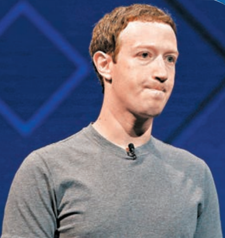
fb 證實被「劍橋分析」不當挪用數據的用戶人數，最高可達 8,700 萬，遠高於傳媒原先估計的 5,000 萬。fb 行政總裁朱克伯格承認犯下重大錯誤。

社交網站 facebook(fb) 用戶資料外洩風波擴大，公司前日首次證實，被數據分析公司「劍橋分析」不當挪用數據的用戶人數，最高可達 8,700 萬，遠高於傳媒原先估計的 5,000 萬。fb 行政總裁朱克伯格承認在事件中犯下「重大錯誤」，強調願意承擔責任，但坦言修補平台漏洞或需時數年。fb 同時宣佈推出多項新措施，包括禁止第三方應用程式收集用戶信仰和政治等個人資料，並於下周一通知所有用戶檢查第三方程式所獲得資料。