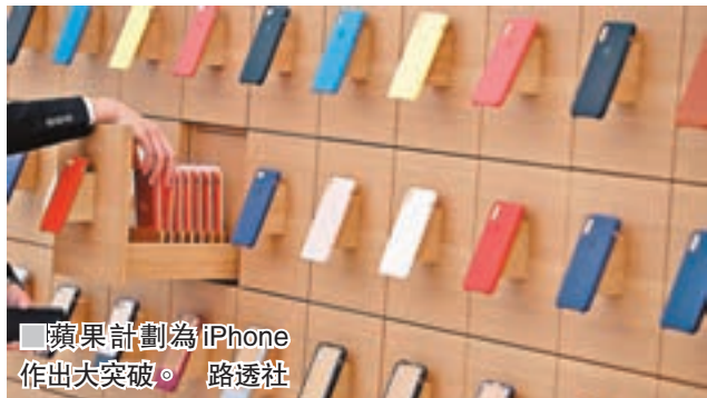
蘋果計劃為 iPhone 作出大突破。

近年各大廠商的智能手機趨同化情況日益嚴重，作為業界龍頭的蘋果公司 iPhone，無論外觀設計、硬件以及軟件功能，都開始被競爭對手追上甚至比下去。為了突圍而出，據報蘋果正研發數款全新技術，目標希望在兩至三年後投入市場，包括毋須直接觸摸屏幕便可操作手機的非觸式操作系統，以及向內彎曲的手機屏幕。