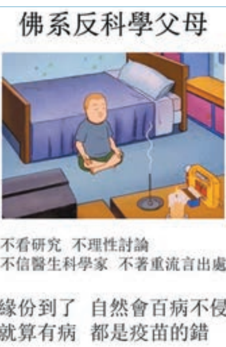
網民製圖揶揄反科學父母。