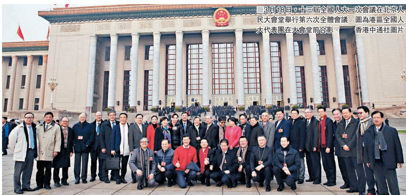
3月18日，十三屆全國人大一次會議在北京人民大會堂舉行第六次全體會議。圖為港區全國人大代表團在太會堂前合影。

香港文匯報訊 36名港區全國人大代表和200多名港區全國政協委員，肩負參議國是的重任，尤其在每年兩會期間為國家的發展建言獻策。有代表形容，港區代表和委員擔當起內地與香港橋樑的角色，向中央及有關部門反映港人的意見，同時向港人解釋國家的方針政策，推動香港更好地融入國家發展大局。同時，在支持特首和特區政府依法施政以及一些大是大非的問題上，港區代表和委員更積極發聲，推動「一國兩制」偉大事業成功落實。