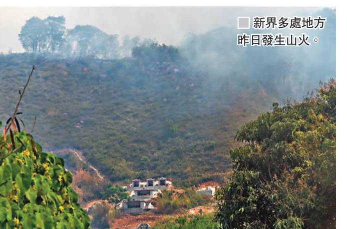
■ 新界多處地方昨日發生山火。