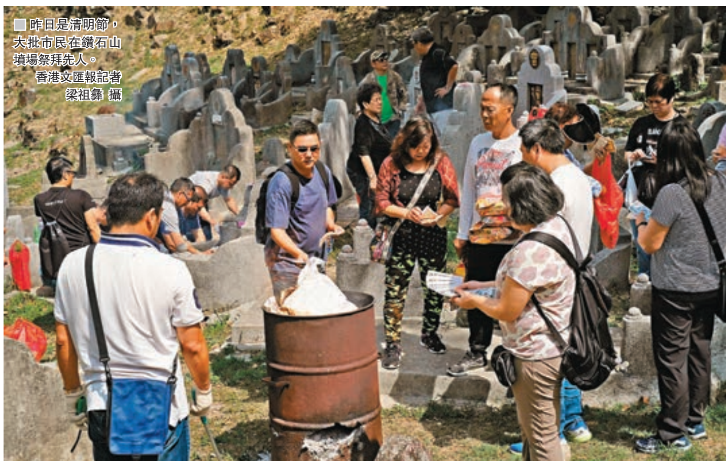
■ 昨日是清明節，大批市民在鑽石山墳場祭拜先人。

李婆婆表示，無論實屬還是燒肉都較去年貴，前者由約80元加至約100元，燒肉則由約50元加至近80元，她總共花費約200元，較去年增加約20%，因此特別選擇自行散買實屬一份實屬，並減少祭品數量以省開支。