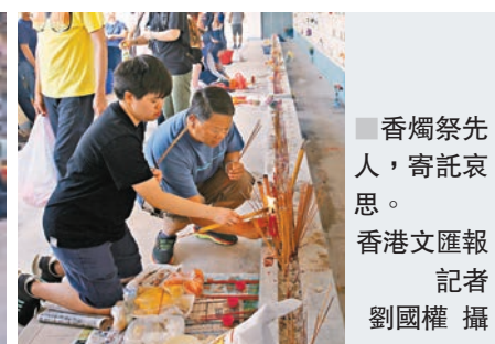
■ 香燭祭先人，寄託哀思。