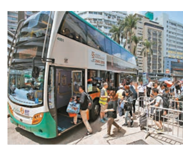
■ 柴灣墳場人流管制措施較去年改善。