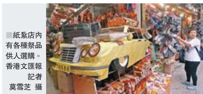
■ 紙紮店內有各種祭品供人選購。