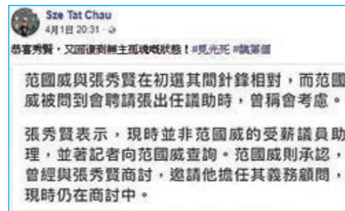
▲神駒「恭喜」張秀賢搵唔成老闆。