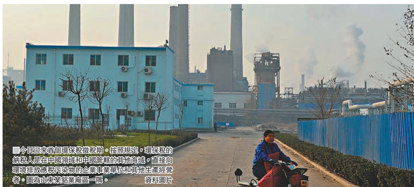
今日迎來首個環保稅徵稅期。按照規定，環保稅的納稅人是在中國領域和中國管轄的其他海域，直接向環境排放應稅污染物的企業事業單位和其他生產經營者。圖為山東某鋼鐵廠區一隅。

時刻效能配置系數的乘積，從大到小確定優先配置次序，航空承運人按照優先配置次序在航班時刻池中選擇航班時刻。