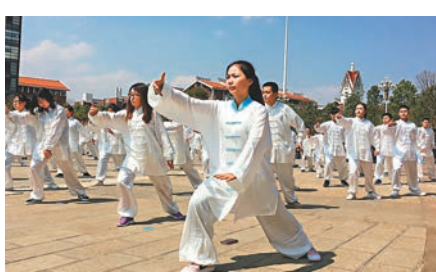
「高校太極國際聯盟」在雲南民族大學正式成立。圖為現場進行的太極表演。香港文匯報記者譚曼煦 攝

香港文匯報訊（記者 譚曼煦 昆明報道）響應國家「帶路」倡議，「高校太極國際聯盟」日前在雲南民族大學正式成立，來自印度、泰國、緬甸、越南、老撾、尼泊爾等國家及國內100餘所高校加入，聯盟將致力於太極運動在高校間教、學、研全方面、多層次、高水平合作，更好地整合各方資源，推動太極運動在國內外的推廣與傳播。同時，「太極研究院」、「太極國際學會」也正式宣告成立。