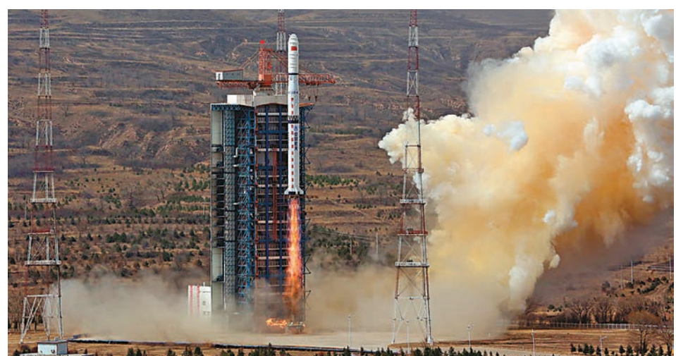
昨日，中國在太原衛星發射中心用長征四號丙運載火箭，以「一箭三星」方式將「高分一號」02、03、04衛星成功送入預定軌道。

香港文匯報訊（記者 劉凝哲 北京報道）昨日11時22分，中國在太原衛星發射中心用長征四號丙運載火箭，以「一箭三星」方式將「高分一號」02、03、04衛星成功送入預定軌道，這標誌着中國首個民用高分辨率光學業務星座投入使用。據介紹，「高分一號」02、03、04星將與已在軌運行的「高分一號」01星、今年擬發射的「高分六號」衛星組網運行，共同構建