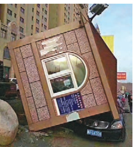
烏魯木齊市大白山街某小區收費崗亭被大風吹倒，車主無恙。香港文匯報新疆傳真

香港文匯報訊（記者 應江洪 新疆報道）自前日晚開始，新疆烏魯木齊市出現7級以上大風天氣，並持續至昨午，當地鐵路、公路、民航等部門在相應地區實施應急管控，居民日常生活受到一定影響。烏魯木齊地窩堡國際機場運行指揮中心發佈信息：截至昨日17時，受大風影響共取消進出港航班151班；滯留旅客5,218人。較早時候，烏魯木齊機場已啟動大面積航班延誤橙色應急響應。而鐵路方面，新疆鐵路部門亦啟動大風天氣應急響應，決定3月31日烏魯木齊至重慶K1584次、烏魯木齊至庫爾勒Z6506/Z6507次、烏魯木齊至北京西Z70次列車晚點待定；3月31日烏魯木齊南至吐魯番北D8836次、吐魯番北至烏魯木齊南D8835次列車停運。