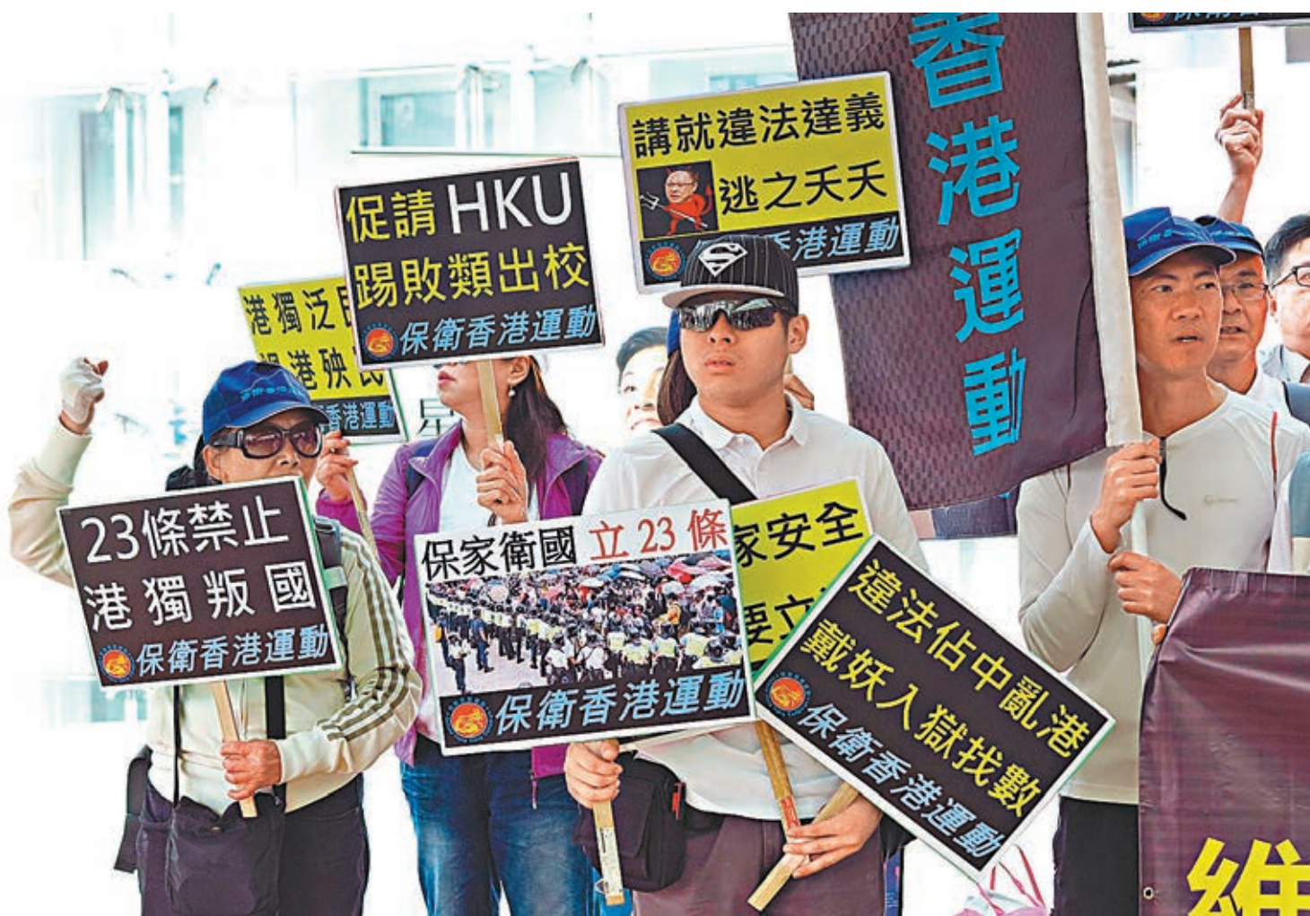
有團體發起示威反戴耀廷。

香港文匯報訊(記者 范童)「佔中三丑」之一的戴耀廷(戴妖)近日赴台出席「五獨論壇」,更公然發表「建國」狂言。民建聯、工聯會及新社聯等昨日分別發表聲明,強烈譴責戴耀廷分裂國家,違反香港基本法,試圖分裂國家,同時破壞香港的穩定,特區政府必須嚴正執法,並盡快履行基本法二十三條立法的憲制責任。有政界人士更呼籲,特區政府及香港大學跟進是次事件,包括革除戴耀廷教席,以免莘莘學子再受影響,令「獨」繼續滋生。