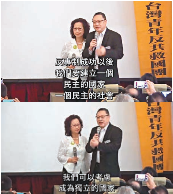
「戴妖」在「五獨論壇」上曾明言「建國」。 影片截圖