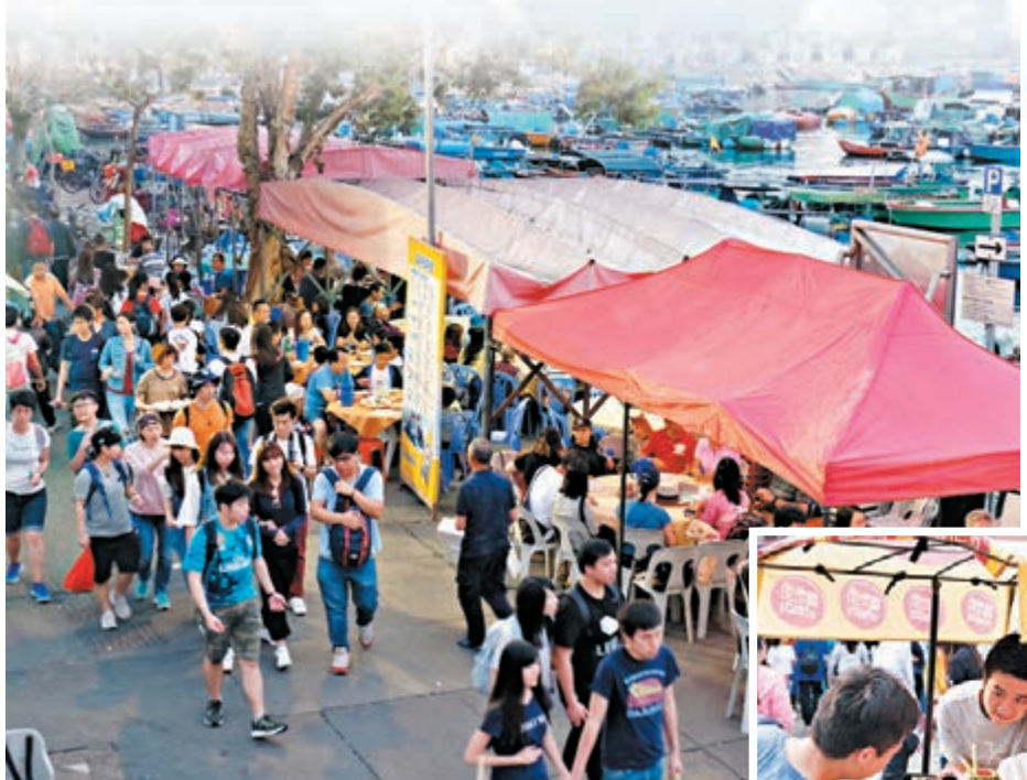
▲▲復活節假期首天,長洲遊人如鯽。

香港文匯報訊(記者 文森)一連4天的復活節假期除了是外遊的理想時機外,不少市民亦選擇留港享受離島之旅,其中長洲昨日同樣是遍滿度假的市民。有島上商戶形容首日復活節假期旺丁亦旺財,生意做到無停手,今年的人流比去年更加暢旺,預計未來幾日會有更多市民入長洲度假。不過,有長洲居民繼續投訴大批市民湧入長洲影響他們的日常生活,要求特區政府提出方案改善有關問題。