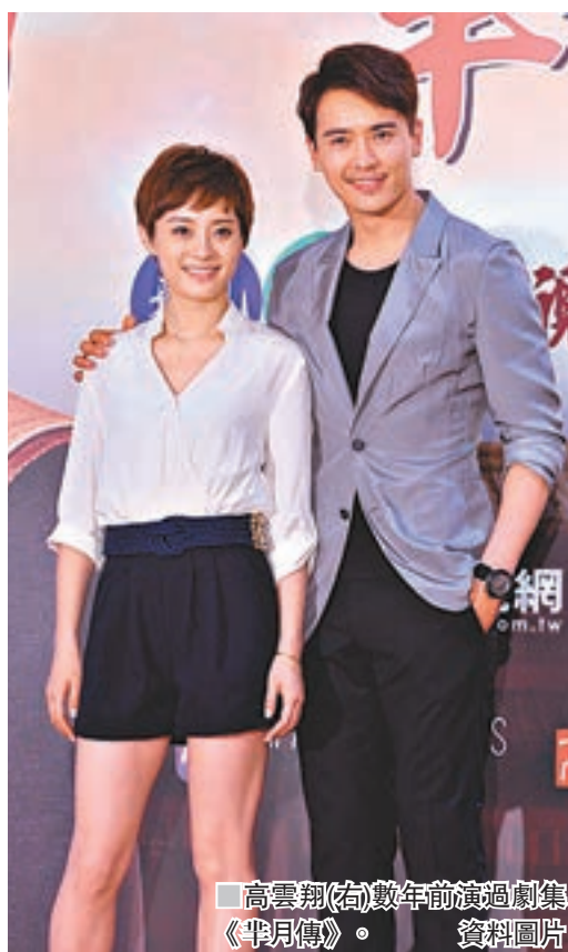
高雲翔(右)數年前演過劇集《半月傳》。

高雲翔 悉尼涉性侵被捕 中社 澳洲媒體昨日報道，內地男星高雲翔最近在澳洲捲入性侵犯醜聞，至今仍被拘留。其律師將為他作無罪辯護，並將在日後申請保釋。高雲翔的經理人表示不清楚事件。昨天有網站引述《每日電訊報》報道，指一名36歲女子向警方投訴稱，本月26日她在悉尼香格里拉酒店的房間內遭高雲翔和另一男子性侵，及後兩人被警方逮捕，至今仍被拘留。襲擊發生前，她和這兩名疑犯一起進入酒店房間。該女子稱，兩名疑犯中，一名男子於27日下午酒店房間內被捕，另一名男子不久後在悉尼市中心的Haymarket被捕。