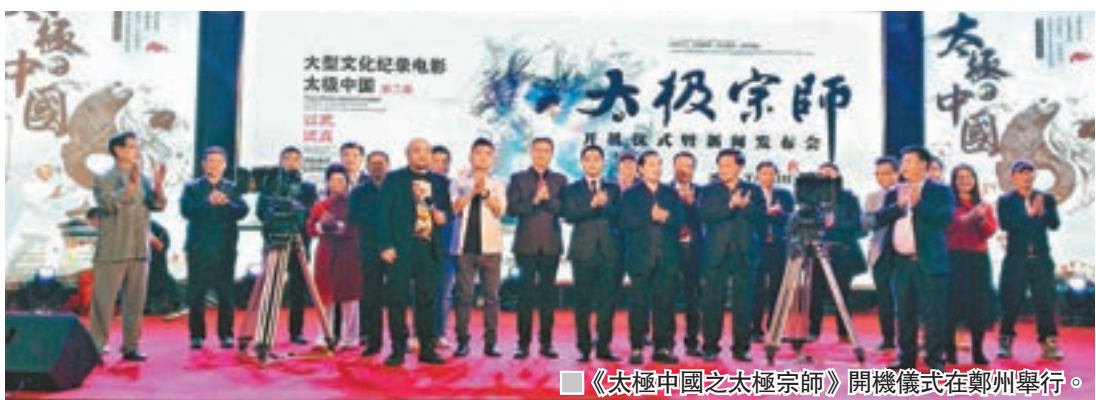
《太極中國之太極宗師》開機儀式在鄭州舉行。