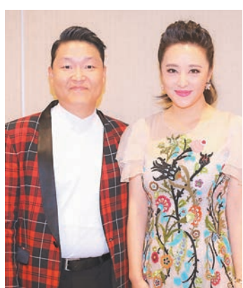
PSY(左)當晚也是表演嘉賓之一。

馮小剛執導的電影《芳華》數月前上映，口碑載道，機靈的曾寶儀得悉大導貴臨，更即興邀請周詠琰老師為馮導演及在座賓客高唱電影片尾曲《絨花》。對於突如其來的「邀約」，周老師沒被嚇倒，反而讓眾人大飽耳福，藉此機會細聽她較少演繹的流行曲。其金嗓子造詣名不虛傳，一眾貴賓包括馮大導均對周老師的唱功讚嘆不已。