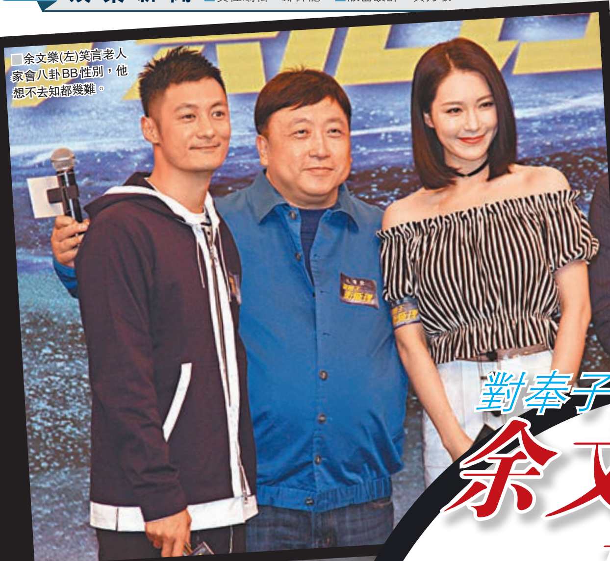
余文樂(左)笑言老人家會八卦BB性別，他想不到不去知都幾難。