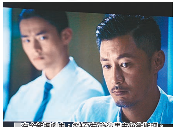
在全新網劇中，樂仔(右)飾主角衛斯理。

至於早前參加影展座談會時拂袖而去，王晶澄清他與另一合作夥伴愛奇藝是被「跳」才出席，實情是小型公司在吹牛，不會影響他在內地的發展。