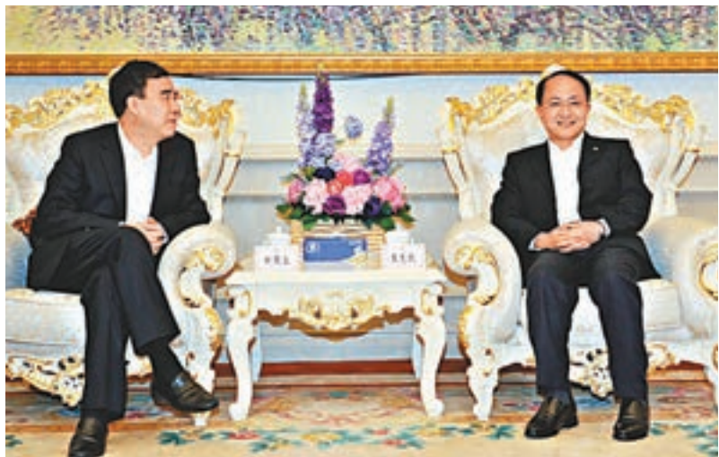
王志民(右)會見中國建設銀行董事長田國立。