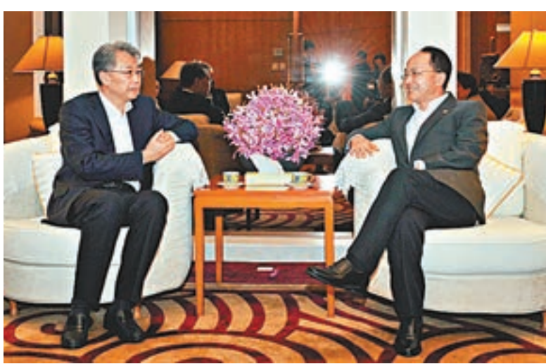
王志民(右)會見中國光大集團股份公司董事長李曉鵬。

會面期間,王志民通報了辦貫徹落實黨的十九大和全國兩會精神的情況,介紹了近期香港經濟社會形勢。五家企業負責人介紹了企業發展及在港機構相關情況。 王志民充分肯定了各中央金融企業在港機構的經營發展,希望各企業深入貫徹落實黨的十九大和全國兩會精神,加大力度支持在港機構的業務發展,帶頭支持特區政府發展經濟、改善民生,幫助解決好香港青年、扶貧、安老等問題,帶頭參與粵港澳大灣區建設,支持香港融入國家發展大局,為香港「一國兩制」成功實踐行穩致遠作更大貢獻。 中聯辦副主任楊健、仇鴻參加了有關會見活動。