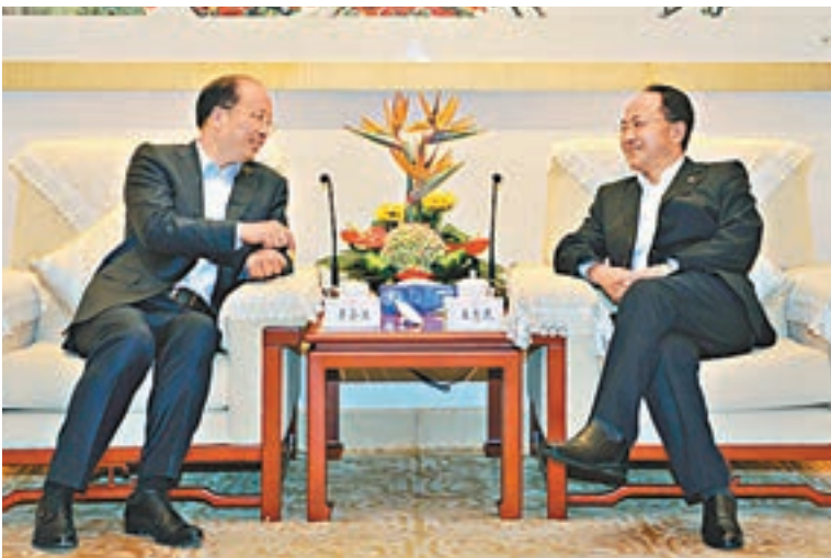
王志民(右)會見中國工商銀行董事長易會滿。