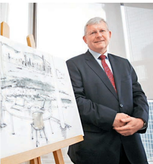
栢志高估計旅舍房租每晚約1,500港元。