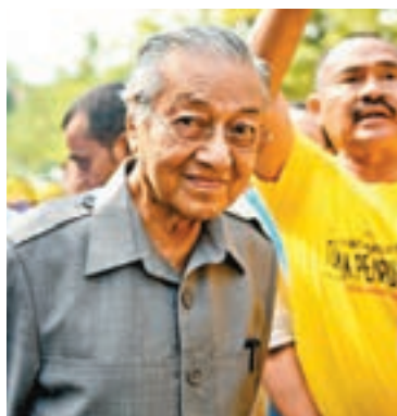
馬哈蒂爾出席集會，反對重劃選區。法新社

納吉布否認重劃選區涉及政治動機，國陣議員梁德明則批評，在野黨反對重劃選區，只反映他們自知無法獲得人民授權。大馬國會日前亦通過「反假新聞」法案，被指是以打擊假新聞為名，箝制言論和新聞自由，並趁機打擊異己。 ■美聯社/路透社/法新社