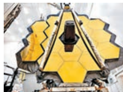
「詹姆斯·韋伯」太空望遠鏡

美國太空總署(NASA)前日表示，原定今年服役的「詹姆斯·韋伯」太空望遠鏡將延遲至2020年5月發射，讓工程師有更多時間解決眾多技術問題。「詹姆斯·韋伯」是史上最強大的太空望遠鏡，比著名的哈勃太空望遠鏡靈敏度高約100倍，可捕捉極微的太空訊號，讓天文學家窺探宇宙初期形成的第一批銀河。