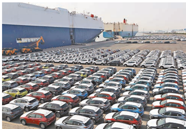
韓國汽車將面對美進口汽車更大競爭。

不過澳洲金融評論網分析認為，協定表面上方便美國車廠打入韓國市場，但事實上美國汽車在韓銷量一直遠低於韓國進口限額，顯示韓國人並不熱衷美國車，不見得協定能改善情況。韓國人傾向購買體積較小的汽車，美國車企卻未有因應韓市場需求