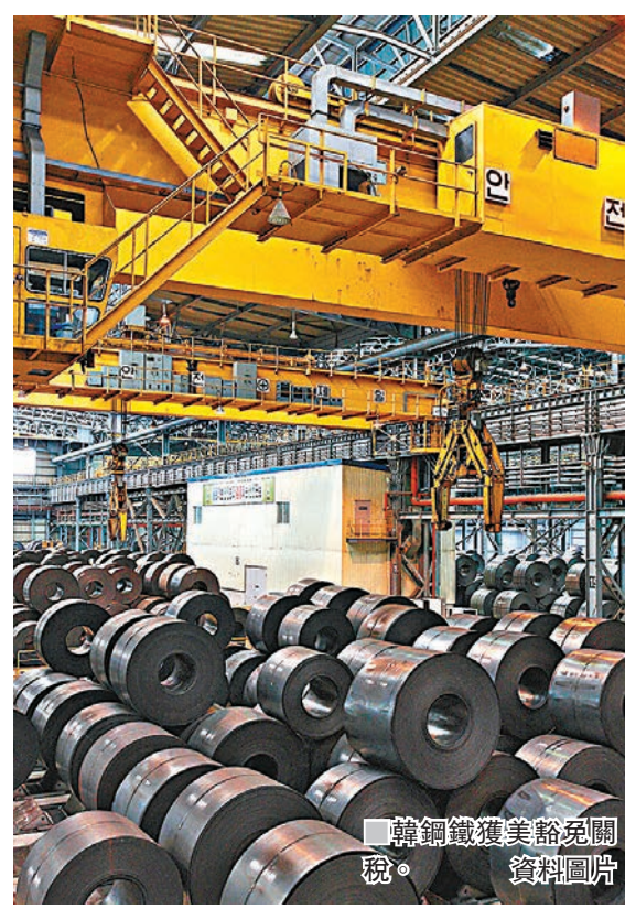
韓鋼鐵獲美豁免關稅。資料圖片