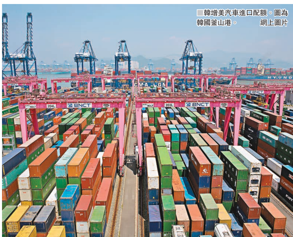
韓增美汽車進口配額。圖為韓國釜山港。

美國首次在自貿協定添加貨幣條款，要求韓國增加外匯市場干預手段的透明度，並保證韓圓不會因競爭原因被刻意貶值。有關條款被視為「附約」，所以美方不會以貿易制裁手段強制實施，雙方仍就附約的細節部分商討。美國財政部本月15日將發表匯率報告，外界揣測韓國是否在自貿協定上讓步，換取美國不把韓國列入「匯率操縱國」，華府官員不予置評。改善匯市干預透明度，意味韓國須公佈用在平息匯市波動所用的資金額。報道指，韓央行以往曾買入或沽售美元，來穩定韓圓兌美元之間的激烈波動，但從未提供官方數字，外界質疑韓國刻意貶值本幣來提升出口競爭力。 ■《華盛頓郵報》/《紐約時報》/路透社/美聯社