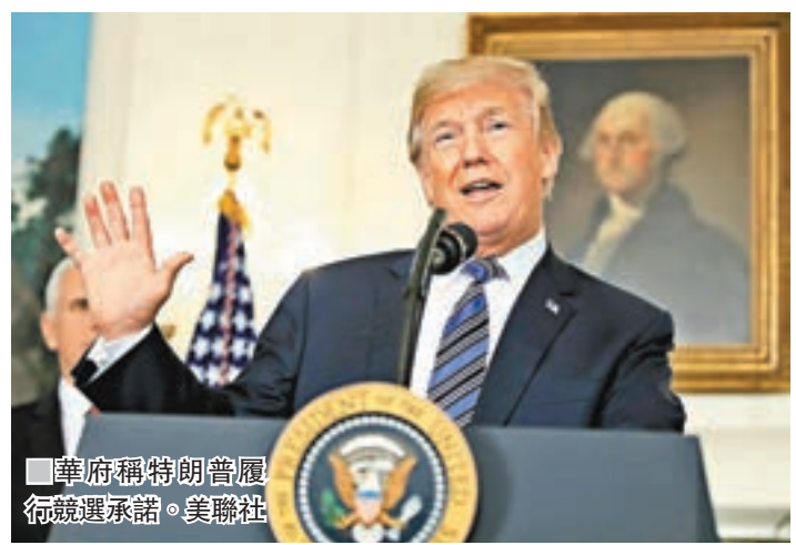
華府稱特朗普履行競選承諾。

國際社會紛紛抨擊美國推出貿易保護措施之際，美國和韓國昨日宣佈，就修訂美韓自由貿易協定(KORUS)原則上達成共識，韓方同意美國延長對韓國出口的貨車徵關稅，換取豁免繳交美國早前宣佈的鋼鐵進口稅，但仍要將出口至美國的鋼鐵量減少30%。美國亦歷來首次在自貿協定附加貨幣條款，要求韓方保證韓圓不會以競爭為理由貶值。有分析認為，美韓短短數月就迅速商定自貿協定，有助化解雙方在這項爭議議題的分歧，聚焦對朝鮮外交。