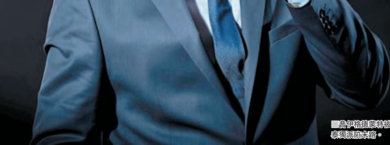
普伊格德蒙特被捕，加泰獨派末路。

西班牙加泰羅尼亞自治區前主席普伊格德蒙特一直流亡比利時，他上周在德國被捕，有可能引渡至西班牙受審。普伊格德蒙特被捕一事具有重大象徵意義，目前自治區多名前任領袖亦面臨被起訴，路透社形容獨派運動已陷入近年低潮。彭博社分析指，獨派面對抉擇，是追隨一眾前領袖「撼頭埋牆」，還是面對現實、放下激進立場，與中央政府談判。