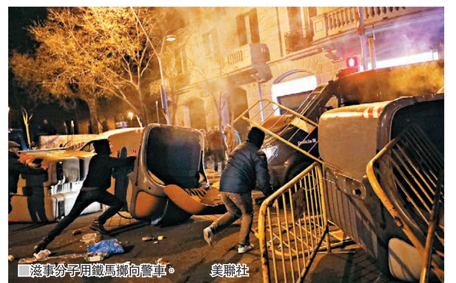
滋事份子用鐵馬擲向警車。