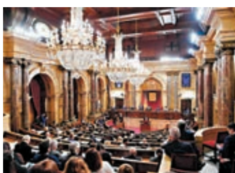
加泰若重選議會，獨派恐失優勢。