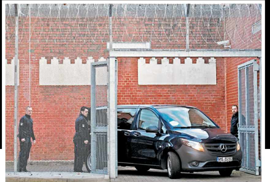
載着普伊格德蒙特的車輛抵達監獄。

加泰羅尼亞前教育部長蓬薩蒂被控叛亂等罪名，被西班牙政府通緝，她昨日在律師陪同下，在蘇格蘭向警方自首並出席聆訊，法院批准她的保釋申請。蓬薩蒂的律師安瓦爾表示，在西班牙不會得到公平審訊，將堅決反對西班牙的引渡申請。主張蘇格蘭獨立的蘇格蘭民族黨(SNP)支持蓬薩蒂，但蘇格蘭首席部長施雅雅強調，政府不能介入引渡程序。