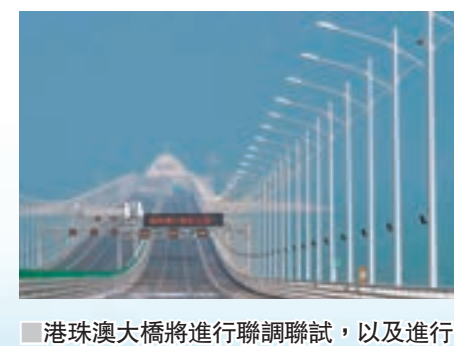
港珠澳大橋將進行聯調聯試，以及進行三方演練。