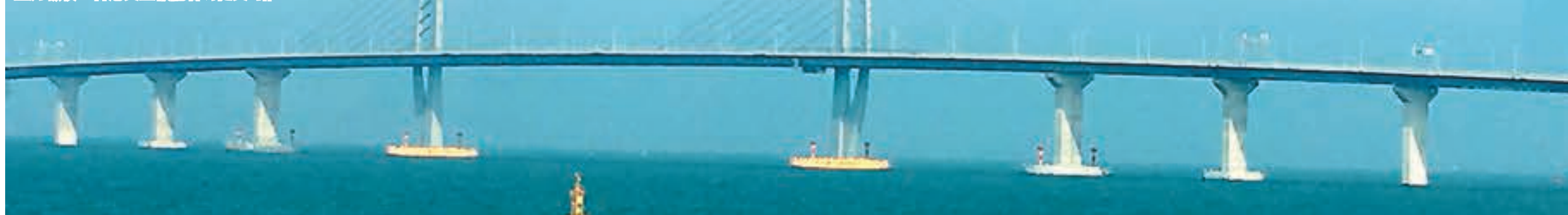
港珠澳大橋經7年時間建成，並於上月驗收。