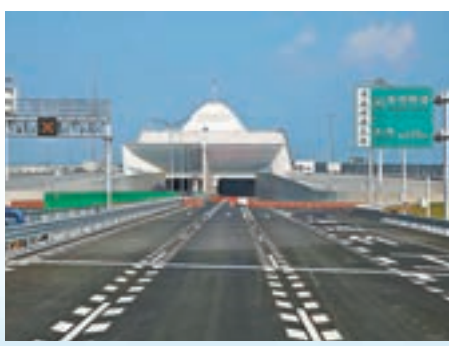
海底隧道全長6.7公里。