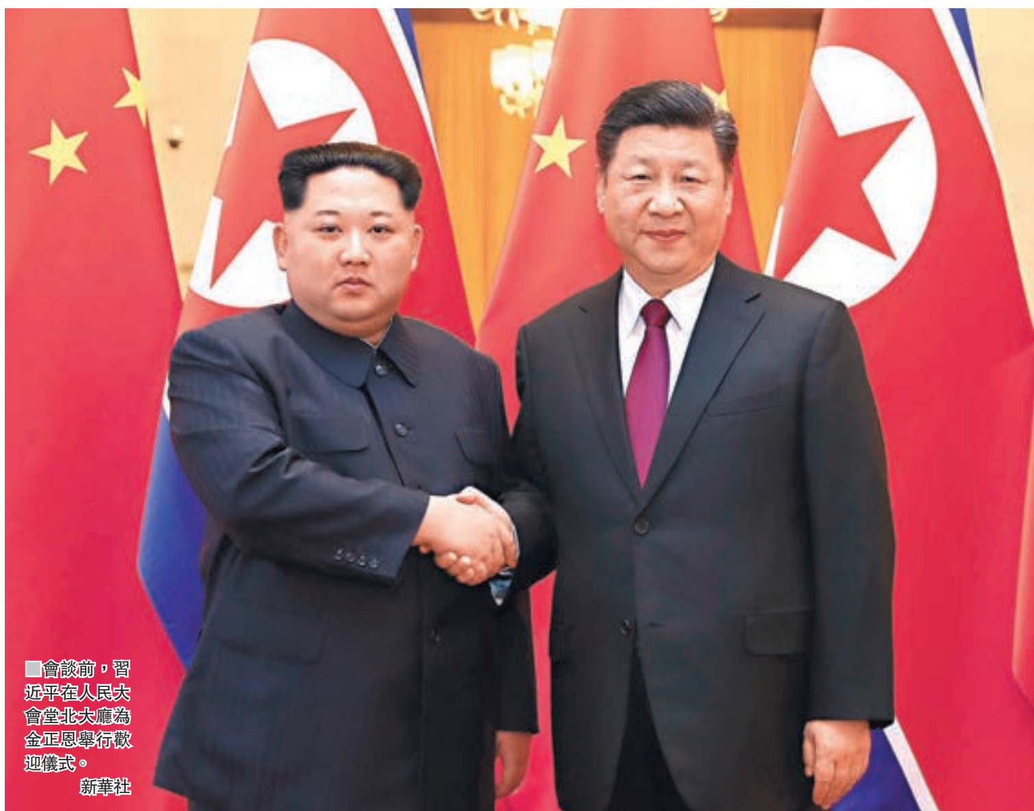
會談前，習近平在人民大會堂北大廳為金正恩舉行歡迎儀式。

習近平強調，中國黨和政府高度重視中朝友好合作關係，維護好、鞏固好、發展好中朝關係始終是中國黨和政府堅定不移的方針。我們願同朝鮮同志一道，不忘初心，攜手前進，推動中朝關係長期健康穩定發展，造福兩國和兩國人民，為地區和平穩定發展作出新的貢獻。一是繼續發揮高層