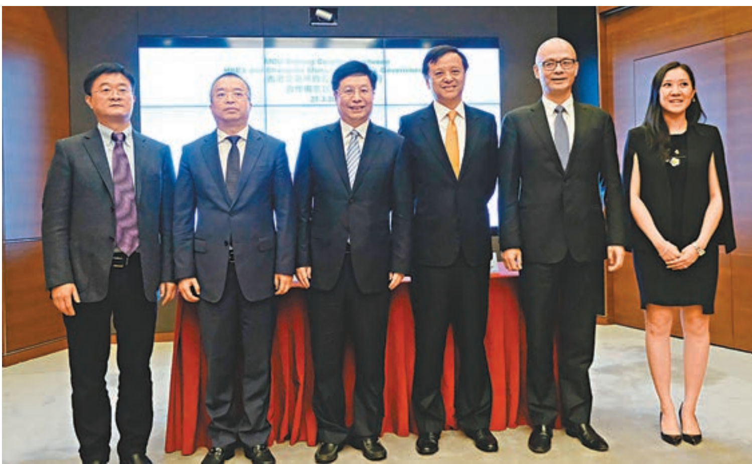
▲左二起：長沙市委常委、副市長付勝華，湖南省委常委、長沙市委書記胡衡華，港交所行政總裁李小加，港交所董事總經理毛志榮。

另外，胡衡華表示，去年年底港交所在上市規則上進行修改，認為有關舉措將對長沙市帶來正面作用；加上十九大提及有關科技創新等議題，期望長沙市加大資本市場的科研發展，與港交所一起建立平台，讓企業上市有更多選擇。