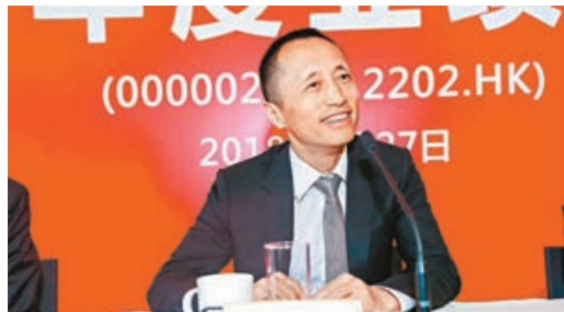
■郁亮指，房價單邊上漲的歷史已一去不復返。

香港文匯報訊(記者 李昌鴻 深圳報導)萬科(2202)董事會主席郁亮昨在業績會上表示，萬科進行戰略轉型，將從過去的城市服務配套商轉為城鄉建設與生活服務商，保持健康可持續和行業領先發展。今年擬增10萬間泊車。