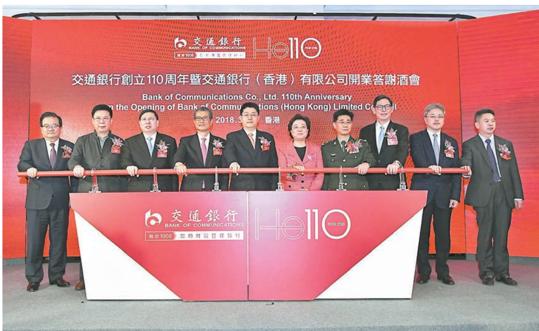
交通銀行昨日在港舉行「交通銀行創立110周年暨交通銀行(香港)有限公司開業答謝酒會」。

交行始建於1908年，是中國歷史上最悠久的銀行之一，也是近代中國的發軔者之一。1987年4月1日，重新組建後的交通銀行正式對外營業，成為