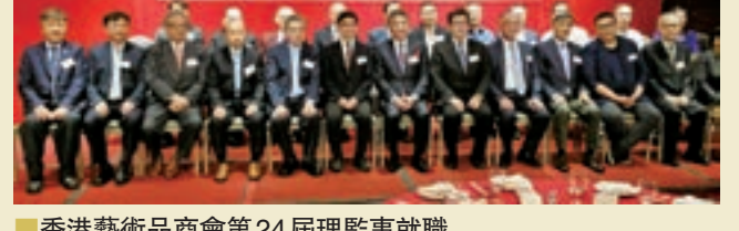
香港藝術品商會第24屆理事會就職

整場晚宴每時每刻都是高潮，穿插着歌唱表演、開心抽獎和書畫拍賣活動，大家笑逐顏開，掌聲熱烈，衷心感謝。