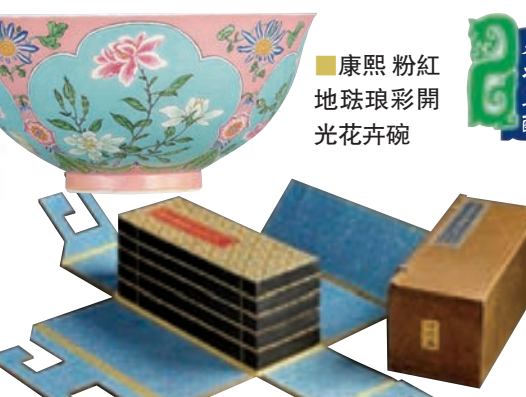
康熙粉紅地磁彩開光花卉碗

明宣德 御製《大般若波羅蜜多經》十卷 香港蘇富比本季春拍，自3月30日至4月3日，假香港會議展覽中心舉行。