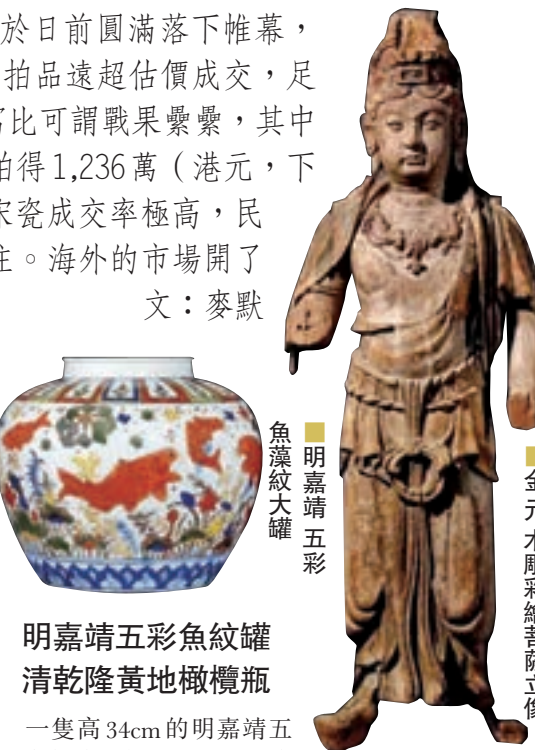
明嘉靖五彩魚藻紋大罐

另一件磁彩繪仙人朝奉圖畫卷，為一個宏大佛教禮佛場景的小部分。圖中描繪的菩薩束髮成髻，盤坐耳前，菩薩雙頰豐腴，唇如櫻綻，杏眼上揚，眉宇下彎，從勾勒的線條可看出畫工用筆極快，筆跡流暢。陰影部分則筆觸較為輕柔地渲染，可見繪者的精湛筆法與生動的造型功力。三位女性菩薩面部刻畫非常有特點，為比較標準的北宋至金代仕女形象，金代木像就時有這類豐潤圓潤的面孔。將菩薩刻畫成圓臉雙下巴，令之更有親和力。