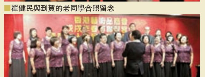
歌聲始終貫穿整個晚宴