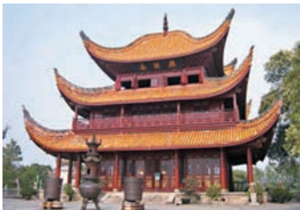
同學在考試前須把課文精華片段背熟，例如《岳陽樓記》的「先天下之憂而憂，後天下之樂而樂」。

雙關 出題年份：2017文憑試 說明：字或是詞同時有雙重意義的修辭法。 另一方面，考生必須留意題幹的提示，或兩題題幹之間互相提示。以2012年文憑試練習卷《目送》第一、二題為例。第二題題幹提示學生第a部分與第b部分呈現對比關係，第c部分與第d部分呈現對比關係。學生如有留意到第二題的提示，回答第一題的內容大意時，必須呈現對比關係。 2016年《紅水番薯》，考生須寫出牽牛花和牽牛花