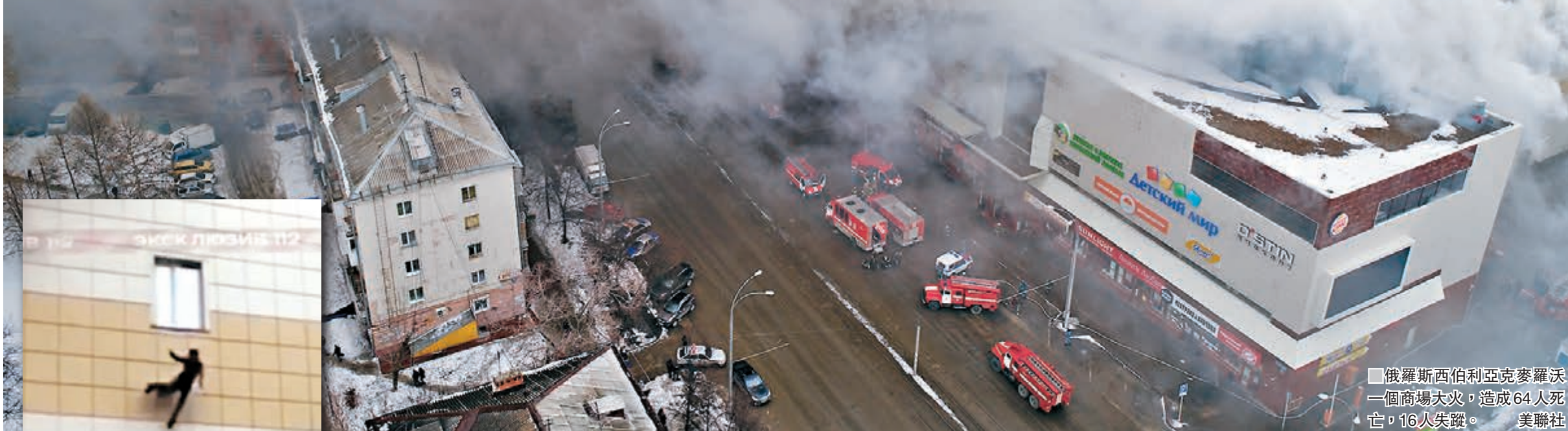
俄羅斯西伯利亞克麥羅沃一個商場大火，造成64人死亡，16人失蹤。

俄羅斯西伯利亞克麥羅沃一個商場前日發生嚴重火警，造成最少64人死亡、47人受傷，當中最少11名死者是兒童，另有16人仍然失蹤，估計凶多吉少。今次是俄羅斯自2009年以來最嚴重火警，事件再次暴露當地消防安全問題，當局拘捕商場東主和租戶等4人問話，並循刑事方向調查起火原因。