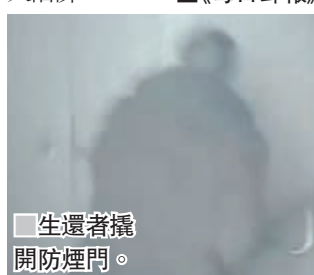
生還者撬開防煙門。

憶述，火警時正與家人看電影，一名女子突然打開戲院大門高呼火警，濃煙瞬間湧入戲院，各人隨即逃出商場。另有商場保安直指，扶手電梯和升降機在火警時仍然運作，加上警鐘沒鳴響，顯示消防系統完全失靈。克麥羅沃市議員戈列爾金透露不少死者均在防煙門附近被發現，形容商場變成殺人陷阱。 ■《每日郵報》