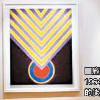
龐圖專題以蕭勤1964年創作《冥想的能量》開篇。