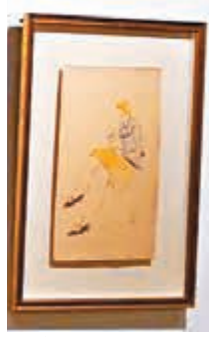
常玉 1920/30年代作《閱讀中的黃裙女士》