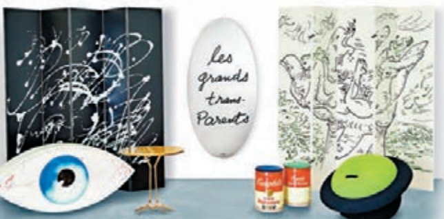
《超移動》系列傢俱設計首現亞洲拍場。

因此，今春蘇富比預展場裡，安迪·沃荷金寶湯罐的椅子、瑪格麗特青蘋果的梳化，與李元佳的「點之作」、日本設計師高兵和秀的屏風畫將共處一室，讓觀者在日常生活場景裡繼續，感受昔日東、西藝術相遇米蘭的前衛氛圍。