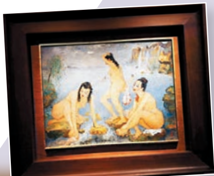
潘玉良約1985年作《海邊五裸女》油畫畫布

新的拍場佈局帶來「新視角」。張嘉珍分析，以「二戰」分界，看似是時間軸承上的切割，實則用「美學」的角度介入理解「亞洲美術的現代化」。她舉例，戰前上世紀30、40年代的華人藝術家代表常玉、徐悲鴻、潘玉良一代，相較戰後50、60年代的趙無極、蕭勤等人，有着幾乎完全不同的創作理念和藝術表現，「因為上世紀末、西藝術不斷交互影響，不同年代環境裡的藝術家，面對各自的時代命題，有着不同的所思所想，自然發展出相異的藝術樣貌。」所以，她提示，只有站在具體歷史環境裡，才能真正理解一個時代作品背後的精神來源和美術性格。