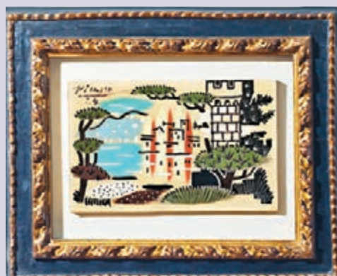
畢加索 1924年作《若安樂松風景》