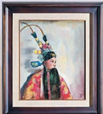
關良生平唯一自畫像(四郎探母)亦將於夜拍呈現。一九五〇年代作

有感此情，張嘉珍特別為之打造視頻，不僅請來模特兒公司選「畫中人」和着鋼琴配樂演繹，旁白更選徐志摩「新月派」詩作，讓巴黎春日的意亂情迷風吹入畫，吹動人心。