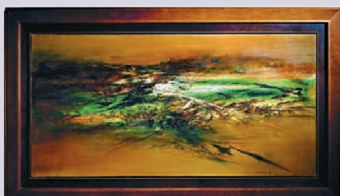
趙無極 1962年狂草畫作《24.04.62》120號尺幅