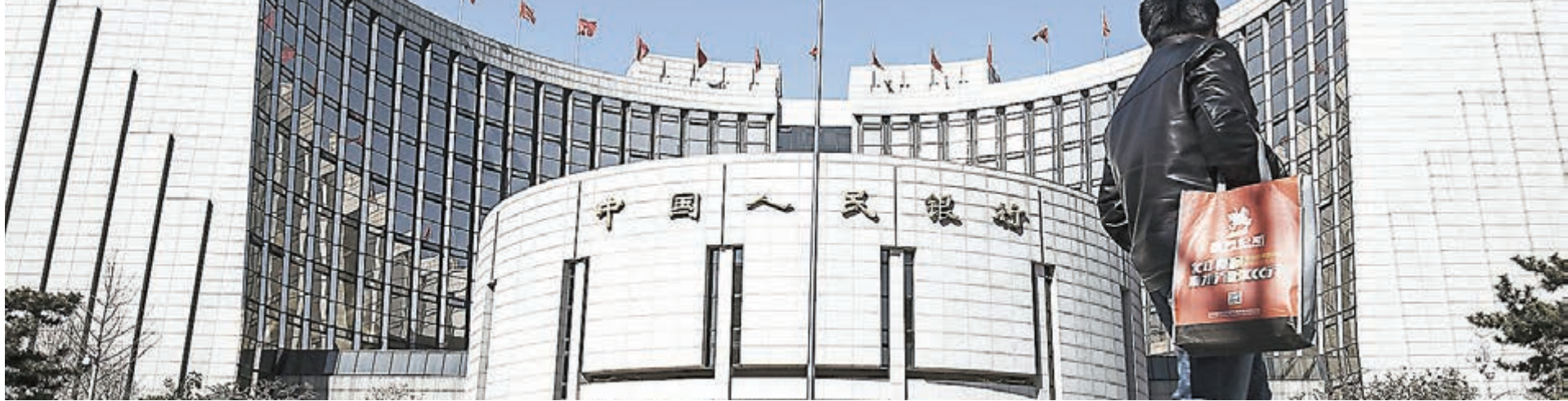
專家表示,央行這一打破常規人事安排,主要目的是推進金融監管體制改革,理順央行和銀保監關係,確立央行在金融監管中的統領地位。圖為央行總部大樓。

歷史上,中國央行行長和黨委書記通常由一人擔任,僅有的例外是1993年至1995年期間,中國人民銀行行長由時任國務院副總理朱鎔基兼任,黨委書記則由副行長周正慶擔任,周正慶亦被外界看作是當時央行日常工作的實際負責人。1995年後,央行又歷經戴相龍和周小川兩位行長,他們都同時兼任黨委書記之職。