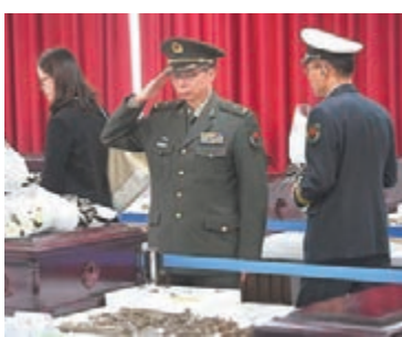
昨日,中韓雙方在仁川「中國人民志願軍烈士遺骸臨時安置所」共同舉行第五批在韓中國人民志願軍烈士遺骸裝殮儀式。

據悉,韓方於2017年3月至11月在韓國境內共發掘出20具中國人民志願軍烈士遺骸及相關遺物。根據今年2月1日中韓雙方在北京磋