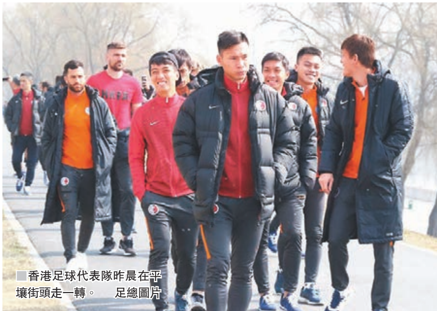
香港足球代表隊昨晨在平壤街頭走一轉。

香港代表隊前日抵達平壤，並為亞洲盃外圍賽對朝鮮備戰，球隊指經過之前的集訓已大抵適應當地天氣。而香港U17及香港U15兩支青年隊，就在昨日的國際青年邀請賽，分別不敵印度以及馬來西亞，僅得亞軍。