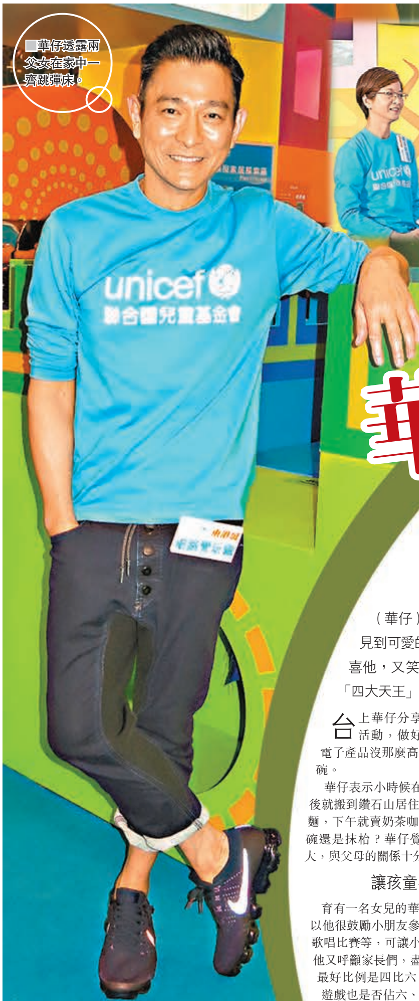
華仔透露兩父女在家中一齊跳彈床。