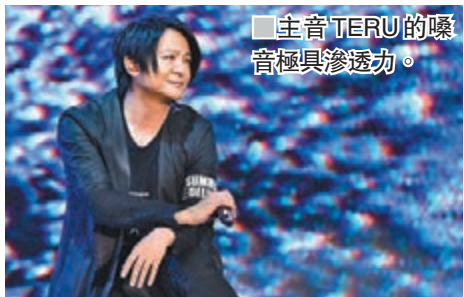
主音TERU的嗓音極具滲透力。

演唱會約晚上8時06分開騷，GLAY一出場全場歌迷即站立應援，氣氛熱烈。GLAY以新歌《The Other End of the Globe》揭開序幕。隨後再唱《Deathtopia》及《ASHES-1969-》，接着主音TERU用日文講「我愛你」，向港迷大送飛吻，他更誠意十足地用廣東話道：「香港嘅朋友好耐無見，好掛住大家！我哋返嚟啦，今日我哋一齊創造美好回憶！」到唱名作《生存的勇氣》時，TERU嘗試趣味讓歌迷和唱，可惜歌迷未及反應，慘