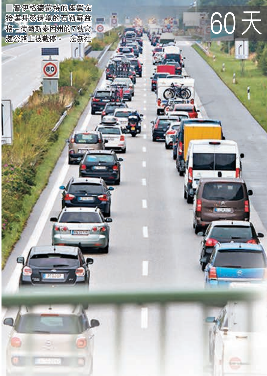
普伊格德蒙特的座駕在接壤丹麥邊境的石勒蘇益格-荷爾斯泰因州的7號高速公路上被截停。