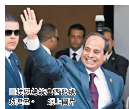
埃及總統塞西勢成功連任。

與前總統穆巴拉克一樣，軍方被視為塞西的最大權力支柱，雖然沙菲克和阿南未能參選，但已經反映軍方內部存在不滿塞西的聲音。塞西的反應是加強集權，除了讓家人出掌情報部門和反貪部門，亦先後