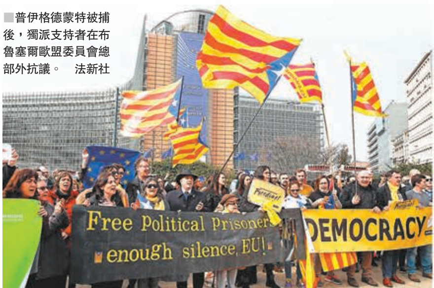
普伊格德蒙特被捕後，獨派支持者在布魯塞爾歐盟委員會總部外抗議。

普伊格德蒙特上週四獲邀抵達芬蘭，先後會見芬蘭國會議員及舉辦座談會，西班牙最高法院翌日隨即宣佈以叛亂及煽動叛亂等罪名，起訴包括普伊格德蒙特在內13名加泰羅尼亞分離分子，並對普伊格德蒙特和另外5名在逃人士發出EAW。