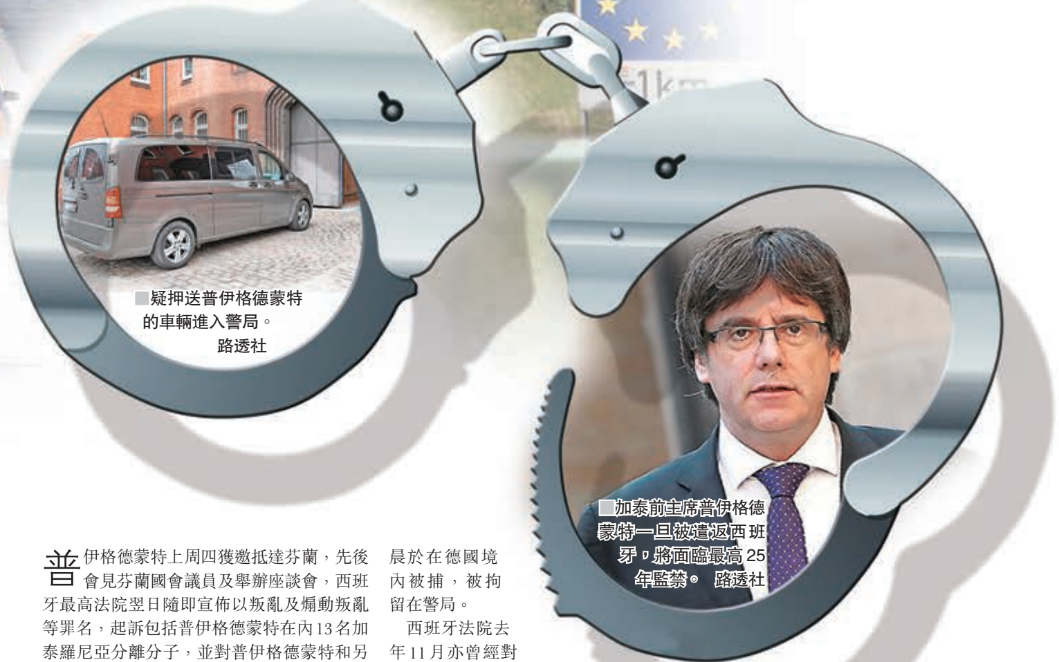
疑押送普伊格德蒙特的車輛進入警局。路透社