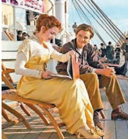
《鐵達尼號》劇照背景換上塞西的肖像。

隨著大選臨近，埃及各地可見印有總統塞西頭像的宣傳品，網民則發揮創意，將塞西頭像融入電影和電視劇圖片當中，例如電影《鐵達尼號》里安納度狄卡比奧和琦溫絲莉坐在甲板一幕，後面被改圖加入支持塞西的標語。2001年電影《魂離情外天》(Vanilla Sky)亦被惡搞，湯魯斯跑過時代廣場時，廣場掛滿塞西的廣告牌。《哈利波特》和美劇《老友記》亦被塞西「入侵」。