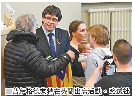
普伊格德蒙特在芬蘭出席活動。

加泰羅尼亞議會去年單方面宣佈獨立，觸發西班牙中央政府出手接管後，普伊格德蒙特隨即前往比利時展開流亡生涯。他因發動非法獨立公投，被西國檢察部門起訴叛亂及煽動叛亂等罪名，一旦返回西班牙，或面臨入獄25年。