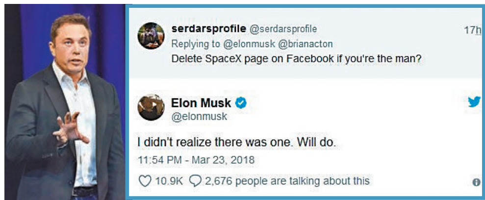
馬斯克回應網民刪除 SpaceX fb 專頁的要求。