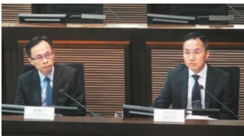
聶德權(左)昨日回應議員就國歌法本地立法的提問。

聶德權重申，特區政府理解公眾和議員希望知道觸犯國歌法的不同情境，但由於要視乎每宗個案，暫時很難就每個情境一概而論，又強調在國歌法本地立法時，會兼顧香港普通法的法律制度及香港的實際情況。