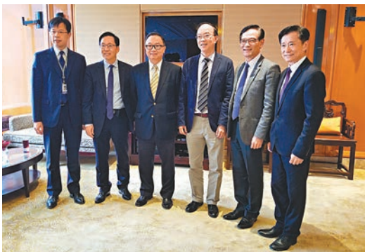
「六人組」昨與傳媒舉行「遲來的春茗」。