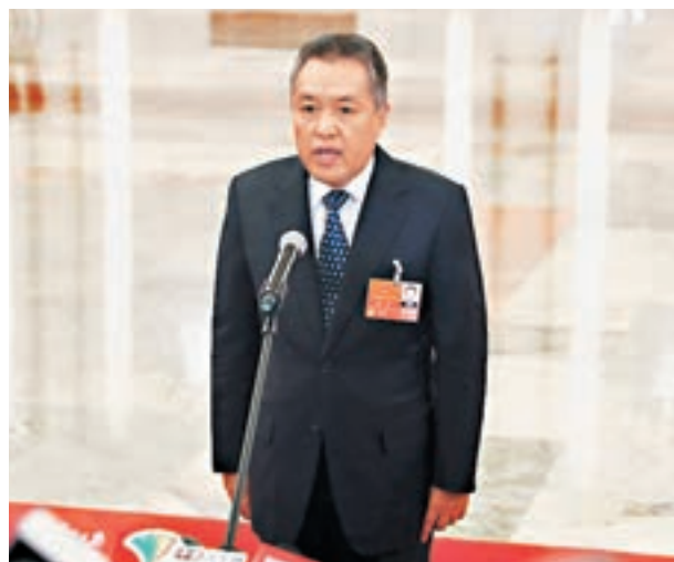
張茅日前在十三屆全國人大一次會議的「部長通道」接受媒體採訪。資料圖片