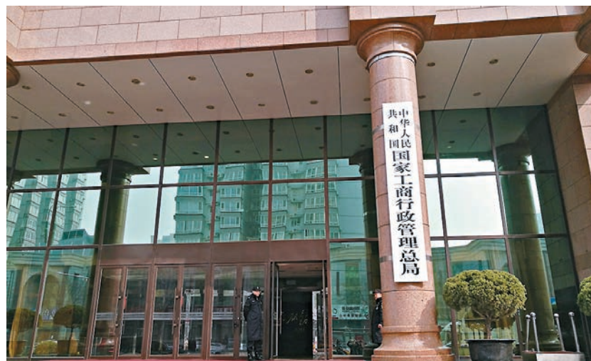
原國家工商總局牌匾。