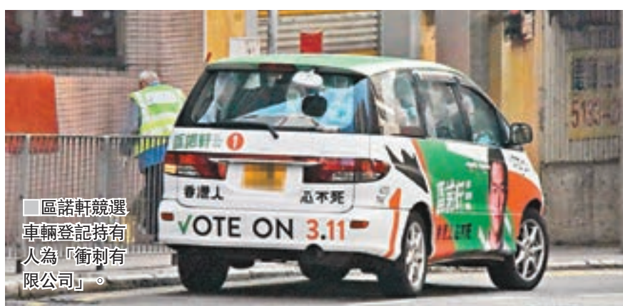
區諾軒競選車輛登記持有人為「衝刺有限公司」。