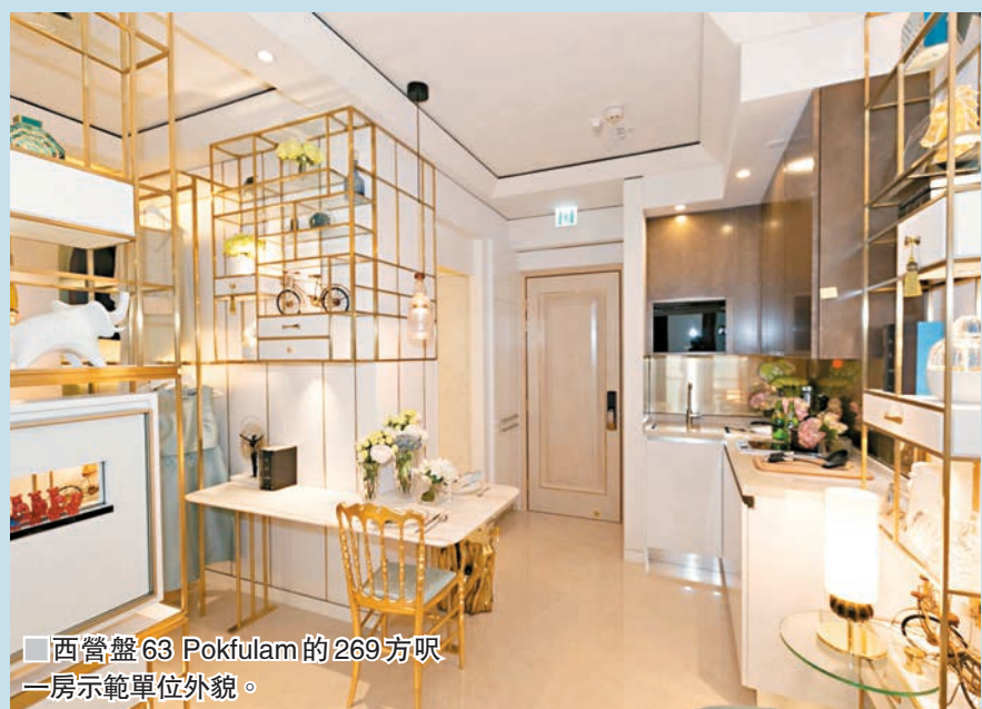
西營盤63 Pokfulam的269方呎一房示範單位外貌。

香港文匯報訊(記者 梁悅琴)納米盤成交呎價連日破頂,九龍建築業旗下西營盤63 Pokfulam昨日以809.1萬元售出第1座25樓E室開放式單位,按面積209方呎計,呎價達38,713元,打破前日同樣由該盤創出每呎達37,651元的全港開放式一手單位呎價紀錄。