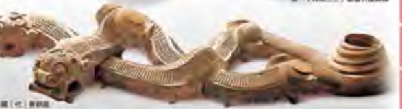
圖為（左）秦銅虎、（中）漢代金鈎、（右）漢代金鈎。

此次展覽採取「小專題大塊式」展陳方式，通過展示各朝代的典型器物，展現出不同朝代的考古發現、歷史事件和重要成就。大連博覽會館展廳表示，這次展覽不僅是周、秦、漢、唐一個個文化片段的精彩展示，更是一個宏觀對照展示歷史文物上文明的發展脈絡。