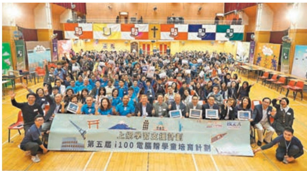
■ 小童群益會日前舉行「i100電腦贈學童培育計劃」啟動禮,在場有嘉賓、同學、家長、義工及大會供圖

對於未能入圍獲全新電腦的家庭,大會亦會作針對性跟進,協助他們購買價格相宜的二手電腦及寬頻服務,幫助基層學生亦能擁有基本電腦上網學習設備,與社會接軌。