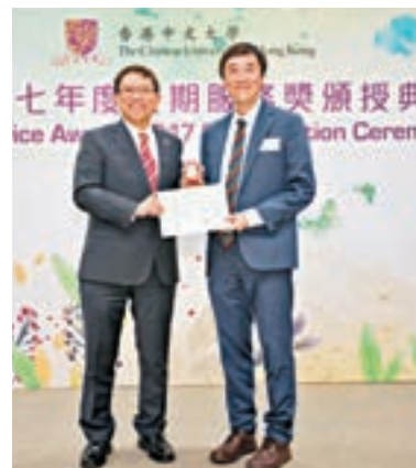
中大校長段崇智(左)頒授長期服務獎予沈祖堯。

香港文匯報訊(記者高鈺)香港中文大學昨舉行長期服務獎頒獎典禮,表揚276名員工服務中大15年至35年的忠誠服務,由校長段崇智主禮。中大前任校長沈祖堯也是受嘉許的同事之一,段崇智特別感謝沈祖堯在服務中大的25年間貢獻良多,帶領大學取得美滿成績。