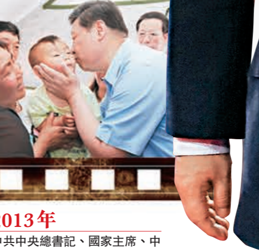
2013年 中共中央總書記、國家主席、中央軍委主席習近平到四川蘆山地震災區看望慰問受災群眾。