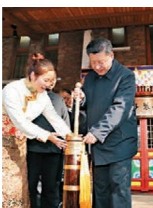
2018年2月12日，習近平在四川汶川縣映秀鎮考察時，親自操作打酥油茶。