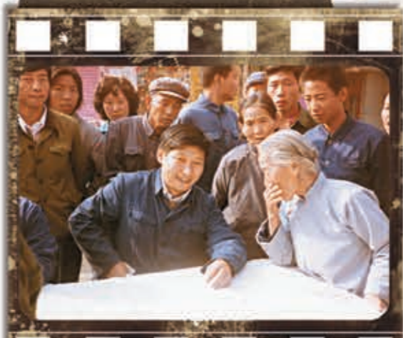
1983年 時任河北正定縣委書記的習近平，臨時在大街上擺桌子聽取老百姓意見。