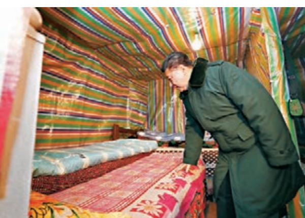
2018年2月11日，習近平在四川考察調研時，到涼山彝族自治州三河村貧困戶吉好也求家中看望。

在新時代的征程上，全党同志一定要抓住人民最關心最直擊最現實的利益問題，堅持把人民群眾關心的事當作自己的大事，從人民群眾關心的事情做起，多謀民生之利，多解民生之憂，在幼有所育、學有所教、勞有所得、病有所醫、老有所養、住有所居、弱有所扶上不斷取得新進展，不斷促進社會公平正義，不斷促進人的全面發展、全體人民共同富裕。 2017年10月25日習近平在黨的十九屆一中全會上的講話