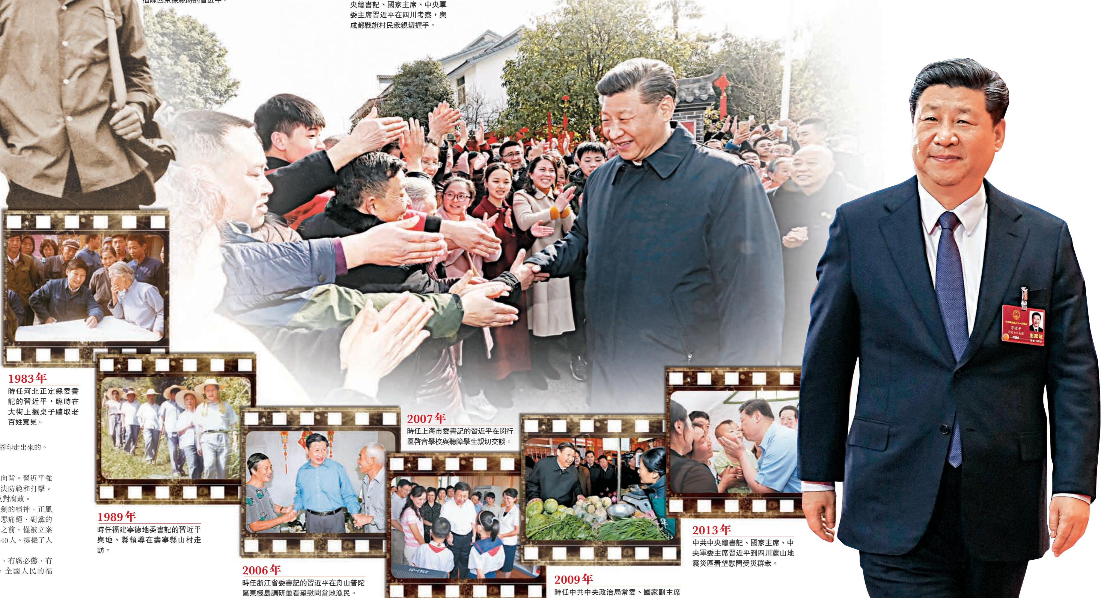
2018年2月12日，中共中央總書記、國家主席、中央軍委主席習近平在四川考察，與成都戰旗村民眾親切握手。