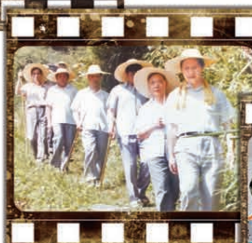
1989年 時任福建寧德地委書記的習近平與地、縣領導在壽寧縣山村走訪。