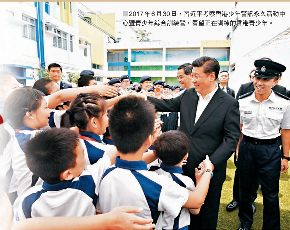
2017年6月30日，習近平考察香港少年警訊永久活動中心暨青少年綜合訓練營，看望正在訓練的香港青少年。