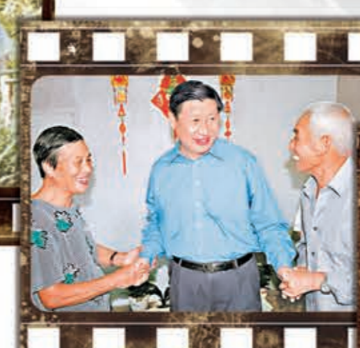
2006年 時任浙江省委書記的習近平在舟山普陀區東極島鋼網並看望慰問當地漁民。