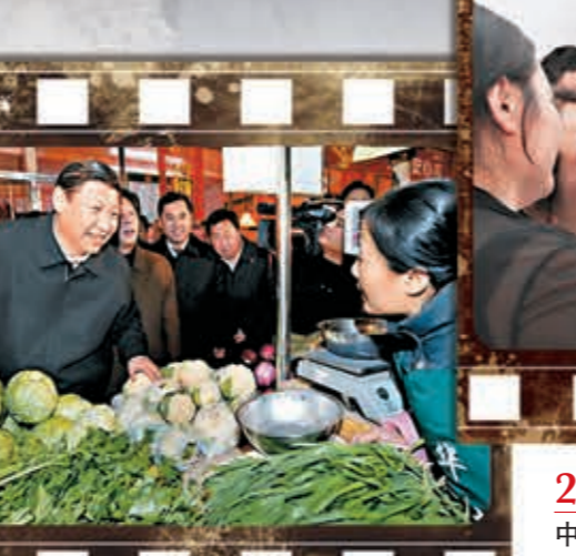
2009年 時任中共中央政治局常委、國家副主席的習近平在天津的菜市場了解價格。