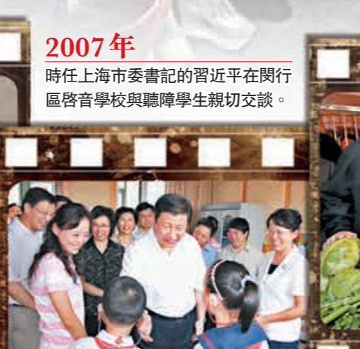
2007年 時任上海市委書記的習近平在閔行區啓音學校與聽障學生親切交談。