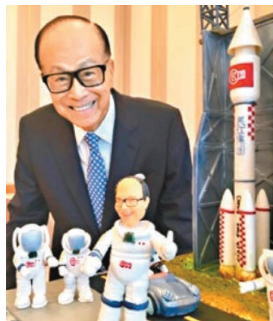
■ 每年生日,同事皆會為李嘉誠設計當時流行議題的蛋糕。(攝於2015年)