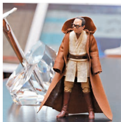
■ 李嘉誠上世紀五十年代經營塑膠廠,與當年認識的美國生意夥伴Alan Hassenfeld成為摯友。每年李嘉誠也收到老朋友為他特製的模型。