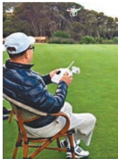
■ 李嘉誠喜歡新玩意。