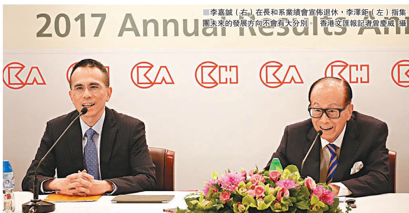
■ 李嘉誠(右)在長和系業績會宣佈退休,李澤鉅(左)指集團未來的發展方向不會有大分別。