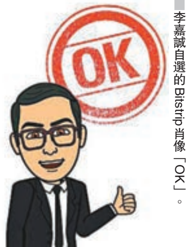
■ 李嘉誠自選的Bisrup肖像「OK」。

長建又指,截至去年底持有97.81億元現金,具備足夠條件於未來進行擴展。未來將繼續與系內長實及電能緊密合作,物色新投資機會,尤以大型項目為重點。