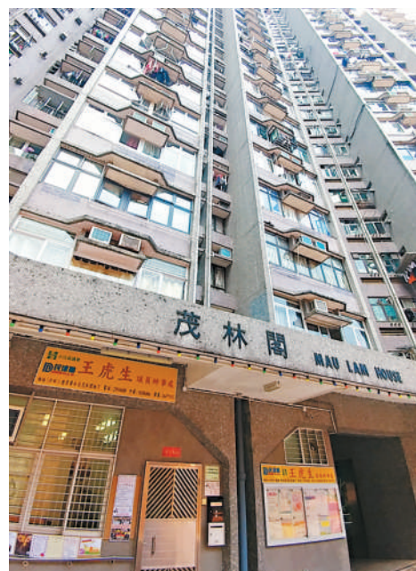
發生搶槍案的沙田廣林苑茂林閣。

醉酒男最終被警員合力制服，混亂間一名警長亦告手部擦傷，3名受傷警員和開槍男子事後送院治理，俱無生命危險。 ■香港文匯報記者 蕭景源