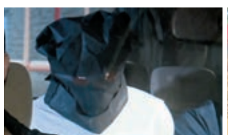
男司機涉運送毒品被捕。

在觀塘法院提堂被控兩項盜竊罪和一項處理贓物罪，被告不准保釋，押至下月12日再訊。 ■香港文匯報記者 蕭景源