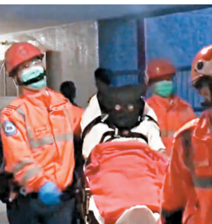
開槍警員疑犯當日亦受傷送院。

是宗搶槍案發生於前日凌晨5時27分，5名警員奉召到茂林閣19樓一單位處理一宗發出噪音的家庭糾紛案時，有人醉酒發難被3名警員按倒地上準備鎖上手銬時，其中一名加入警隊僅3個月的林姓男警，突被對方搶去佩槍，繼而連開3槍。他當場被射中兩槍，另一名男警則被流彈擦傷。