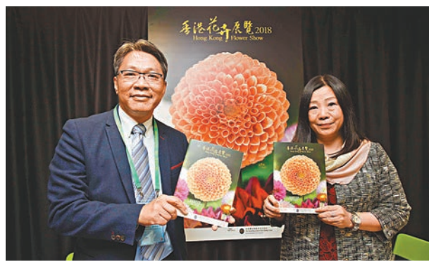
▲今年大會首次以原產地為墨西哥的「大麗花」作為主題花。