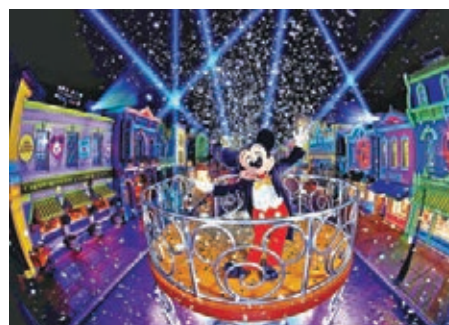
迪士尼推出全新節目「We Love Mickey!」大街投影盛演。迪士尼供圖