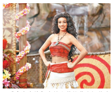
《魔海奇緣》中的女英雄慕安娜將在「魔海奇緣凱旋慶典」登場。

香港文匯報訊(記者 高俊威)為向賓客帶來難忘體驗,香港迪士尼樂園首推橫跨春夏兩季的「迪士尼巨星嘉年華」,由即日起至6月20日推出全新節目包括迪士尼首創的「We Love Mickey!」大街投影盛演、「加利布尼市集」及嶄新舞台表演「魔海奇緣凱旋慶典」等,為賓客帶來一浪接一浪的驚喜。 大街投影盛演將每晚於美國小鎮大街上演。炫目光影投射在大街兩旁房子上,將整條美國小鎮大街改頭換面,幻化成神奇星光大街,展現米奇老鼠演藝生涯中的星光歷程,包括黑白經典造型等,米奇更會盛裝赴會,壓軸現身。 嘉年華舉行期間,迪士尼新舊友將在樂園不同位置亮相,更會換上別具特色的春日服裝與賓客見面合照。全新亮相的超級英雄黑豹與《魔海奇緣》的女英雄慕安娜率先於探險世界現身。電影《銀河守護隊》的大熱角色樹人和超級英雄蜘蛛俠亦會在下月起於明日世界出現。 同時,以「迪士尼明星春日遊園」為主題的創意園藝,除讓賓客觀賞繁花美景,亦可捕捉米奇與迪士尼朋友春日郊遊情景,是拍照的良機。