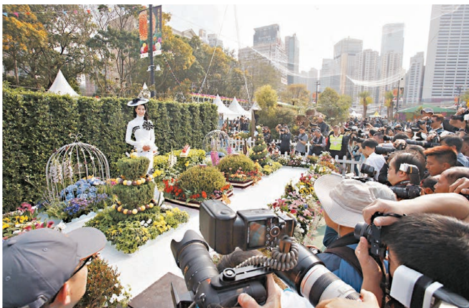
香港花卉展覽昨日舉行攝影比賽。

香港文匯報訊(記者 文森)一年一度的香港花卉展覽今日開始在維多利亞公園舉行。今年花展的主題花是「大麗花」,並以「心花放」為主題,展示來自18個國家及地區的參展機構的花卉、園景與花藝擺設,每晚更會舉行燈光匯演,展期至本月25日止。 今年花展結束後,除了會將花卉轉贈非牟利團體或學校外,更首次將部分花卉送贈市民。