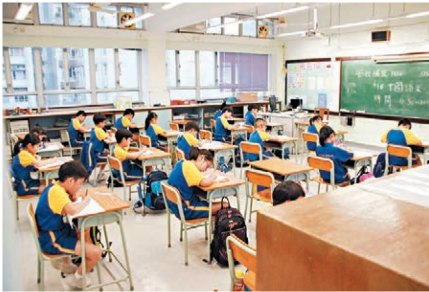
消息指,小三基本能力評估(BCA)檢討委員會將建議評估以全港小學抽樣形式進行,將操練誘因減至最低。圖為小三學生應考BCA情況。資料圖片

香港文匯報訊(記者 姜嘉軒)小三基本能力評估(BCA)檢討委員會今日開會,預料將向教育局提交報告,建議今年繼續進行小三BCA評估。消息指,委員會建議評估以全港小學抽樣形式進行,每所學校抽樣一定比例學生參與評估,而教育局只會獲得全港學生整體結果,不會取得個別學校報告。個別學校可按需要安排更多學生參與,以便獲得詳細校本評估報告改善學與教。教育局局長楊潤雄今日會見記者作進一步交代詳情。