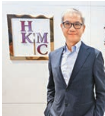
按揭證券公司總裁李令翔認為,基建融資的需求大,公司有興趣發展有關業務。

香港文匯報訊(記者 顏倫樂)去年樓市暢旺,按揭證券公司總裁李令翔昨日表示,按揭保險計劃申請金額按年上升30%,今年首兩月亦升20%,大部分承造八成按揭,承造九成按揭比例不足10%。今年來樓價持續高企,市民上車難度急升,但李令翔指利率趨升及供應增加,令樓市風險增大,認為暫時無須放寬按揭成數,要待樓市風險可控才會考慮放寬。