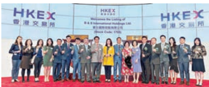
賓仕國際昨在主板上市，其股價收市每手賺11,920元。

香港文匯報訊(記者 張美婷)港股受美股拖累昨日曾跌逾400點，不過掛牌新股未受影響。昨日掛牌兩隻新股均有不錯的成績，當中大熱的「天仁茗茶」經營商賓仕國際(1705)股價更曾升305%，最後收市每手賺11,920元，成為逾十年最賺錢的新股之一；而亞洲實業(1737)則每手賺500元。