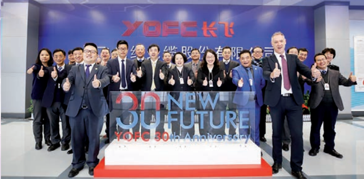
■1月5日,長飛舉行30周年ICON揭幕儀式。

2017年長飛公司海內外營收佔比分別為88.8%和11.2%。相較2016年同期,國內營收增長24.3%;海外營收增長65.0%,約11.60億元。2014年底上市以來,長飛公司實踐其未來五年,每年設立一家海外工廠的