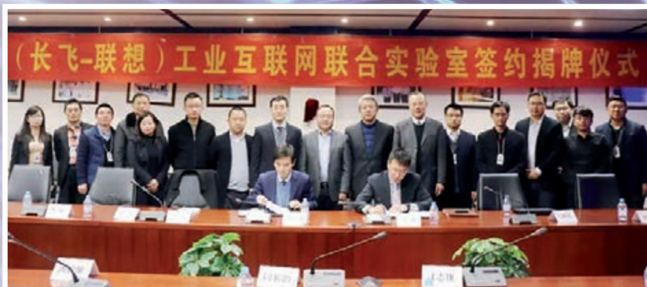
■長飛公司與聯想集團簽署工業互聯網聯合實驗室合作協議。

2018年是長飛公司成立的第30年,從1988年至今,長飛公司從一家外資企業的製造工廠發展成為掌握行業核心技術、全球市場份額第一的集團型企業,實現了從「追隨者」到「領軍者」的蛻變。三十而