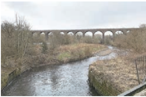
■ 塔姆河微塑膠濃度全球最高。

英國曼徹斯特大學一項調查發現，英國河流的微塑膠污染情況非常嚴重，大量塑膠微粒從工廠和家居進入河流，再流出大海，被海洋生物吞下但無法消化，以致進入人類食物鏈。科學家呼籲從源頭做起，加強規管，阻止塑膠微粒流入河道。