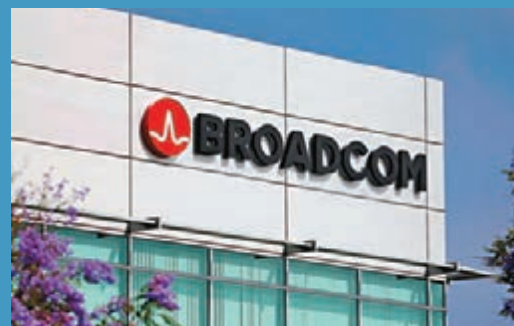
■ 博通以大幅削減成本見稱。