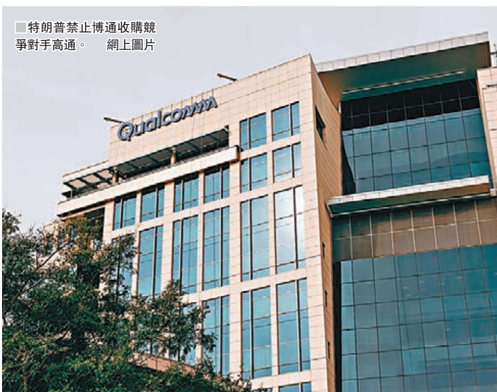
■ 特朗普禁止博通收購競爭對手高通。