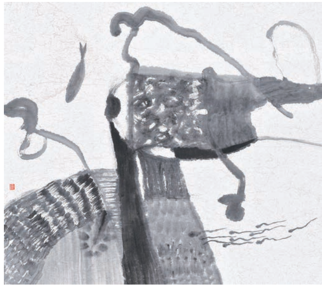
騷動的池塘之十六，化建國，2010年，紙本水墨，74cm x 74cm

「我的作品都是來源於對生活的觀察」。作者與化建國的對話在其剛剛裝修完成的「化境小屋」進行，化建國滿頭銀髮，穿着休閒，其渾身散發的藝術氣息，毫無刻意的裝飾與造作，透露着對生活的隨性與睿智。