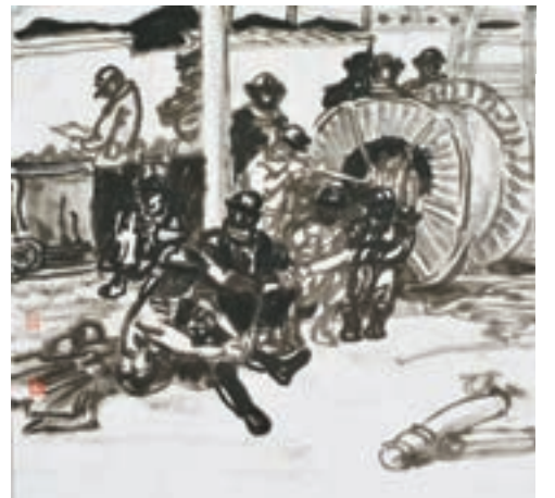
礦工札記，紙本水墨，2014年