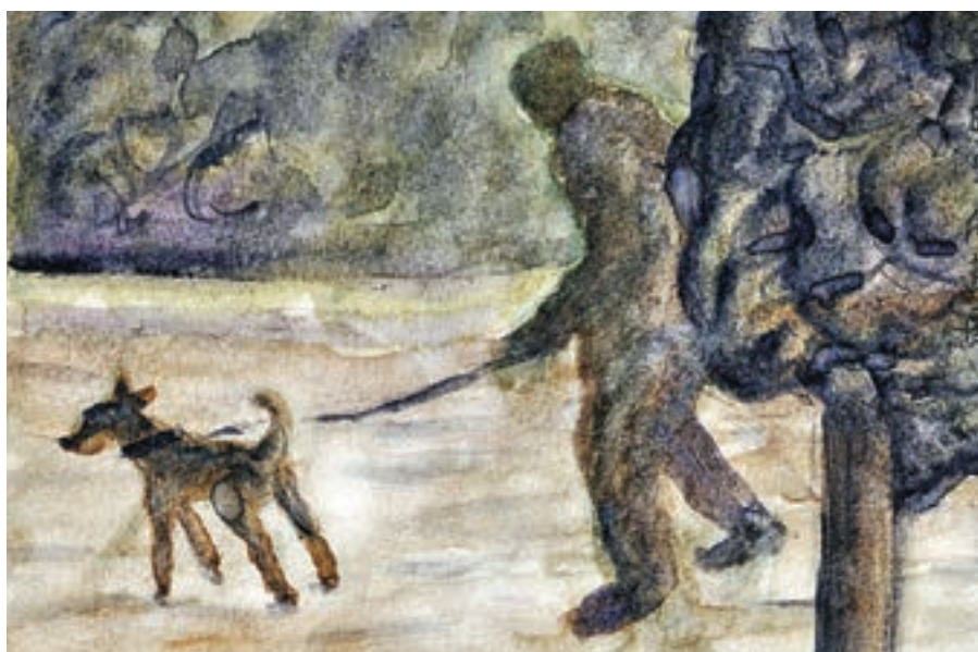
紙言片語系列之遛狗，紙本水彩，2016年