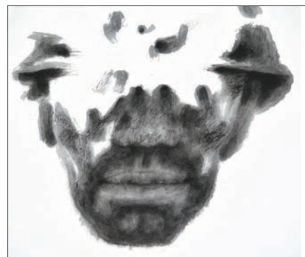
礦工，紙本水墨，2014年，40cm x 40cm

據了解，自2009年新館投入使用後，河南美術館便開始着手「河南省20世紀美術史」的研究梳理和收藏工作，截至2016年底，河南省美術館的藏品數已達3,000多件。在多方面努力下，河南美術館在收藏作品的研究、陳列和使用上均作出了很優異的成績，連續多次獲得文化部和省文化廳的表彰。不僅如此，還把優秀的藏品帶到了中國美術館、深圳關山月美術館、黑龍江美術館等近十個省市進行巡展，多方位地呈現了河南近現代美術的成就以及該館對藏品研究的成果，在全國美術界引起了廣泛的關注和影響。從美術館的藏品陳列展覽中，能看出河南省美術館對藏品的梳理和研究的水平，也能檢驗出其收藏方向是否具有學術性和歷史價值。