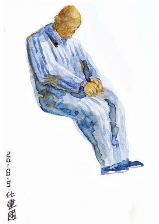
紙言片語系列之病號，紙本水彩，2016年