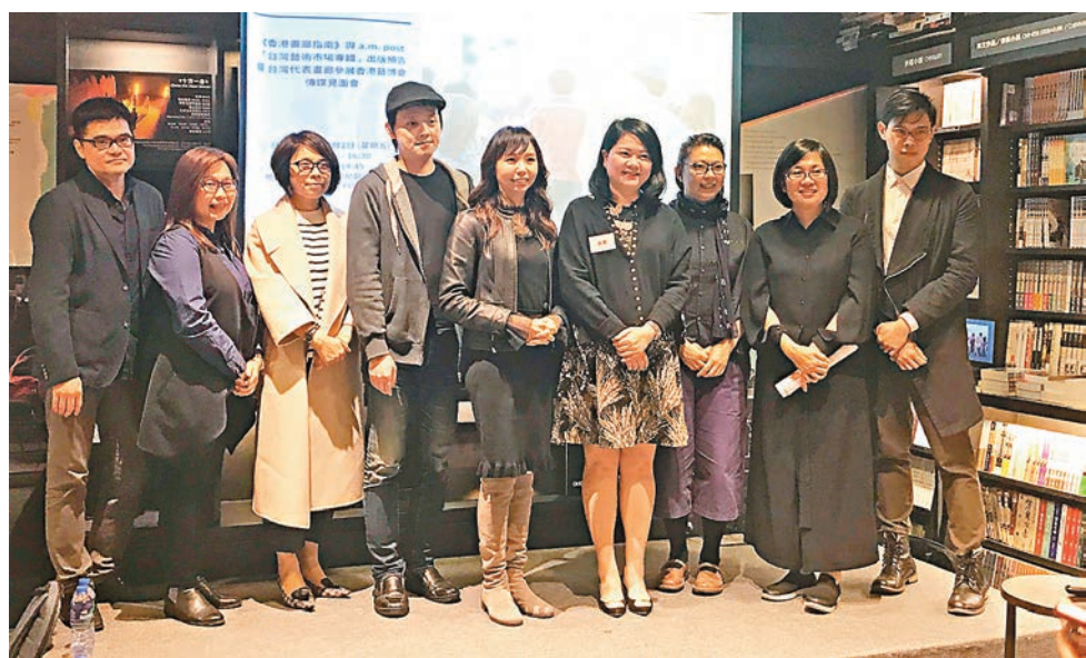
座談會現場嘉賓合影

月底 Art Basel 開幕在即，《香港畫廊指南》與 a.m.Post 合作著寫「台灣藝術市場專輯」並舉辦座談，邀請一班台灣畫廊業界人士與策展人講述台灣在巴塞爾國際藝術博覽會信心與操作定位，於此同時《香港畫廊指南》宣佈最新牟利與非牟利展覽空間數量統計，並提出「定義」畫廊與展覽空間，從經營的面向區分畫廊的種類，透過畫廊的遷移、畫廊增減、經營項目變化分析，指出「直立式畫廊」的時代將改變香港藝術市場的天空。