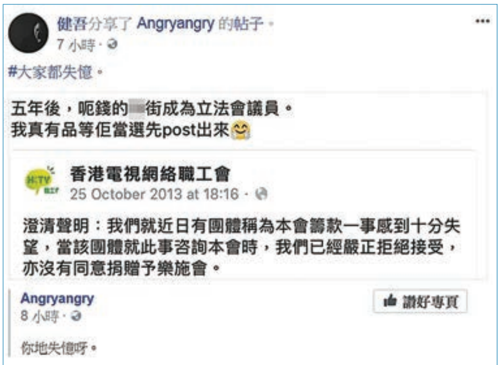
區諾軒被指「呢錢的X街成為立法會議員」。