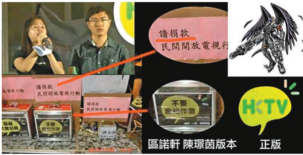
區諾軒被回帶鬧爆。